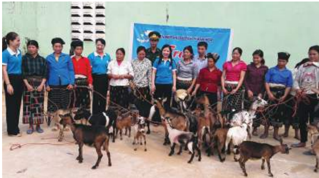
Hội LHPN tỉnh Thanh Hóa trao con giống cho Tổ hợp tác chăn nuôi dê sinh sản xã Yên Khương, huyện Lang Chánh

Thành tích nổi bật: Huy động nguồn lực hiệu quả hỗ trợ phụ nữ nghèo, đã vận động xây dựng 729 Mái ấm tình thương trị giá trên 22 tỷ đồng giúp phụ nữ nghèo có hoàn cảnh đặc biệt khó khăn. Đã có 119.018 lượt hộ nghèo được Hội giúp bằng nhiều hình thức với tổng trị giá trên 88 tỷ đồng; hỗ trợ 14.577 suất quà, trị giá 5 tỷ 360 triệu đồng cho gia đình hội viên bị thiệt hại nặng nề bởi thiên tai, lũ lụt; chuyển giao khoa học kỹ thuật cho 387.910 lượt hội viên, phụ nữ; đào tạo nghề cho 63.087 lao động nữ; xây dựng 300 mô hình kinh tế tập thể; vận động, hỗ trợ 253 hộ phụ nữ khởi sự kinh doanh, thành lập được 14 CLB Doanh nghiệp nữ thu hút hơn 500 nữ chủ doanh nghiệp tham gia; huy động được gần 9 tỷ đồng tổ chức các hoạt động “Đồng hành cùng phụ nữ biên cương”; chỉ đạo thành lập, nhân rộng 1.107 CLB “Gia đình 5 không, 3 sạch”; 1.156 CLB “Gia đình hạnh phúc”; 304 CLB “Phòng chống bạo lực gia đình”; 119 CLB “Dinh dưỡng”; 121 CLB “Gia đình hạnh phúc, bền vững”. 5 năm qua đã có 479.418 gia đình hội viên đạt 8 tiêu chí cuộc vận động, góp phần đưa 06 huyện, 367 xã và 917 thôn, bản đạt chuẩn nông thôn mới.