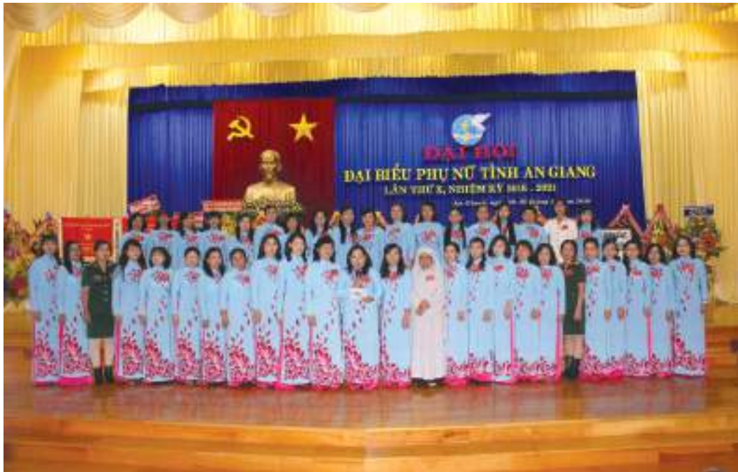
Ra mắt Ban Chấp hành Hội LHPN tỉnh An Giang khóa X, nhiệm kỳ 2016-2021

Thành tích nổi bật: Có thành tích xuất sắc trong việc thực hiện Đề án “Củng cố nâng cao chất lượng tín dụng chính sách khu vực Đồng bằng sông Cửu Long”; 10 năm triển khai thực hiện Luật Bình đẳng giới giai đoạn từ 2007 - 2017; 10 năm thực hiện Cuộc vận động “Người Việt Nam ưu tiên dùng hàng Việt Nam” giai đoạn 2009 - 2019; công tác chỉ đạo, phối hợp thực hiện chính sách BHXH, BHYT giai đoạn 2018 - 2019; công tác phòng, chống dịch Covid-19 năm 2020.