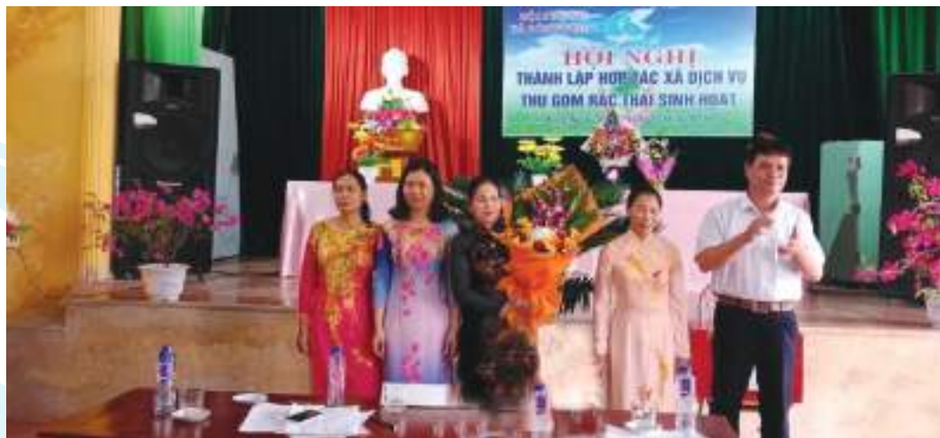
Hội LHPN xã Đông Kinh, huyện Đông Hưng, tỉnh Thái Bình ra mắt hợp tác xã dịch vụ thu gom rác thải sinh hoạt

Thành tích nổi bật: Đã thành lập HTX Dịch vụ thu gom rác thải sinh hoạt với 49 thành viên. Đăng ký tự quản tuyến đường nội đồng 1,5km, 6 đoạn đường hoa dài gần 6km. Tổ chức 100 đợt ra quân vệ sinh môi trường với hàng nghìn lượt chị em tham gia. Xây dựng mô hình “Thu gom và phân loại rác thải tại hộ gia đình” với 100 thành viên. Trao tặng 150 lần nhựa cho 150 hội viên. Xây dựng 02 CLB “Phụ nữ làm theo lời Bác” với 70 thành viên, tiết kiệm được 221 triệu đồng cho 35 lượt hội viên vay. Mô hình “Phụ nữ tiết kiệm giúp nhau mua thẻ BHYT tế tự nguyện” với 30 thành viên, đã mua 24 thẻ bảo hiểm y tế. Trao tặng 115 thẻ bảo hiểm thân thể cho phụ nữ khó khăn. Duy trì mô hình “Giúp phụ nữ nghèo thoát nghèo có địa chỉ bằng việc trao tặng con giống”, đã trao cho 67 hộ gia đình phụ nữ nghèo với tổng số tiền 11,4 triệu đồng. Ra mắt 4 CLB Dân vũ thể thao với 200 thành viên. Giúp phụ nữ, trẻ em có hoàn cảnh khó khăn với số tiền 128 triệu đồng, tặng 03 hũ gạo tình thương với 720kg gạo. Quản lý tốt nguồn vốn vay ủy thác của Ngân hàng CSXH và Ngân hàng Nông nghiệp và Phát triển nông thôn cho 756 hộ gia đình hội viên, phụ nữ vay với tổng số tiền 47,3 tỷ đồng.