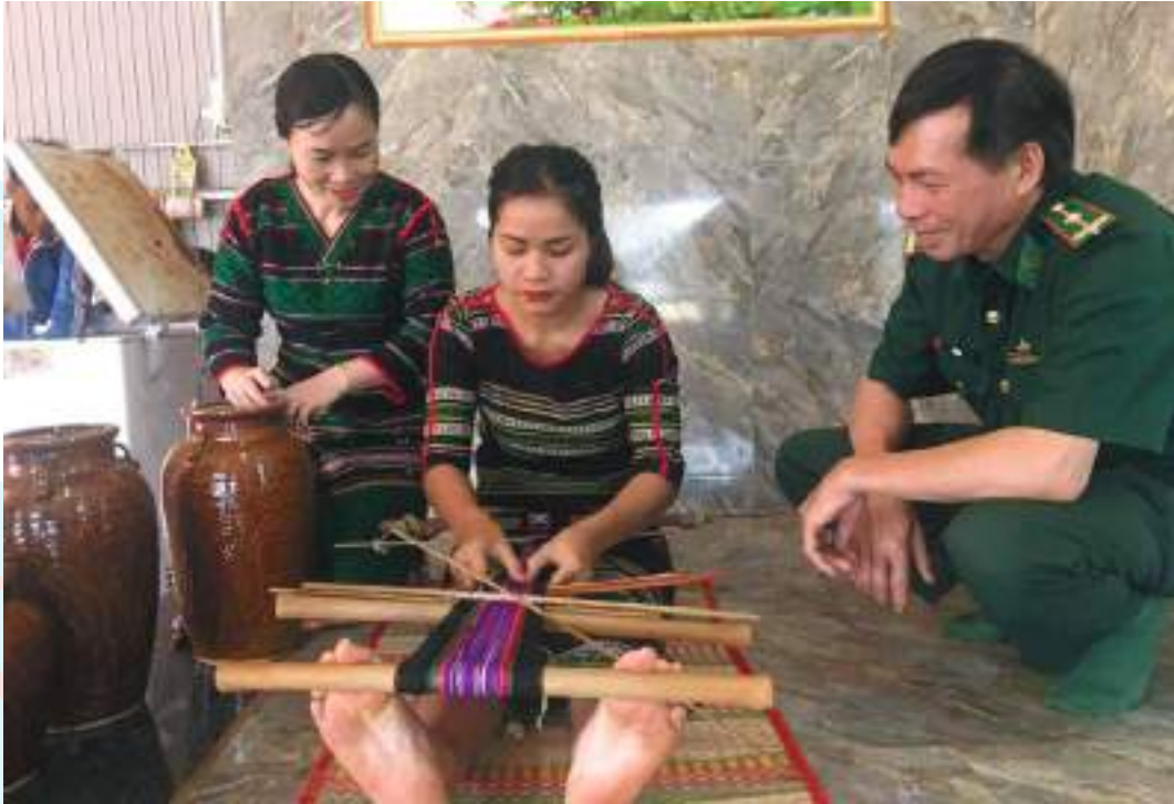
Hội LHPN xã Đắc Bukso hướng dẫn hội viên thành lập tổ hợp tác rượu cần và dệt thổ cẩm