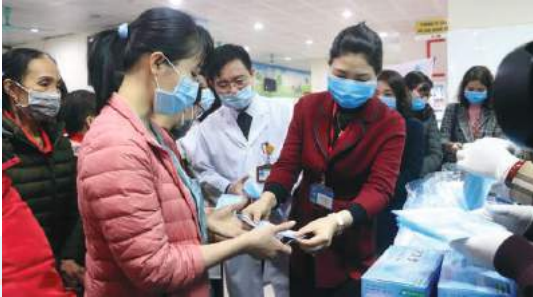
Chủ tịch Hội LHPN tỉnh tặng khẩu trang cho bệnh nhân và người nhà bệnh nhân tại Bệnh viện sản nhi Bắc Ninh phòng chống dịch Covid-19

Thành tích nổi bật: Vận động nguồn lực thông qua đề xuất thành công 10 chính sách/chương trình, đề án với số tiền 157 tỷ 85 triệu, hỗ trợ 110 dự án khởi nghiệp vay vốn qua Ngân hàng CSXH vốn ưu đãi 5%/năm với kinh phí 90 tỷ đồng. Tổ chức 50 cuộc đối thoại với 747 ý kiến đề xuất. Có 709 công trình/phần việc tham gia xây dựng nông thôn mới. Toàn tỉnh có 429 CLB “Phụ nữ hát dân ca Quan họ”, 373 CLB “Bóng chuyền hơi nữ”, CLB TDTT, khiêu vũ, Erobic. 752 “Tổ phụ nữ tiết kiệm mua BHYT” vận động được 83.000 lượt hội viên, phụ nữ tham gia... Vận động 2 tỷ đồng tham gia chương trình “Đồng hành cùng phụ nữ biên cương” tại 5 xã biên giới khó khăn của tỉnh Lạng Sơn và Đắk Lắk, 30.000 suất quà tặng phụ nữ miền Trung và biên giới gặp thiên tai trị giá hơn 1 tỷ đồng, gần 5 tỷ đồng tham gia phòng, chống dịch Covid-19. Tỷ lệ thu hút tập hợp hội viên đạt 84,1%.