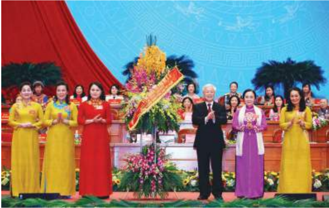
Tổng Bí thư Nguyễn Phú Trọng tặng hoa Đại hội đại biểu Phụ nữ toàn quốc lần thứ XII