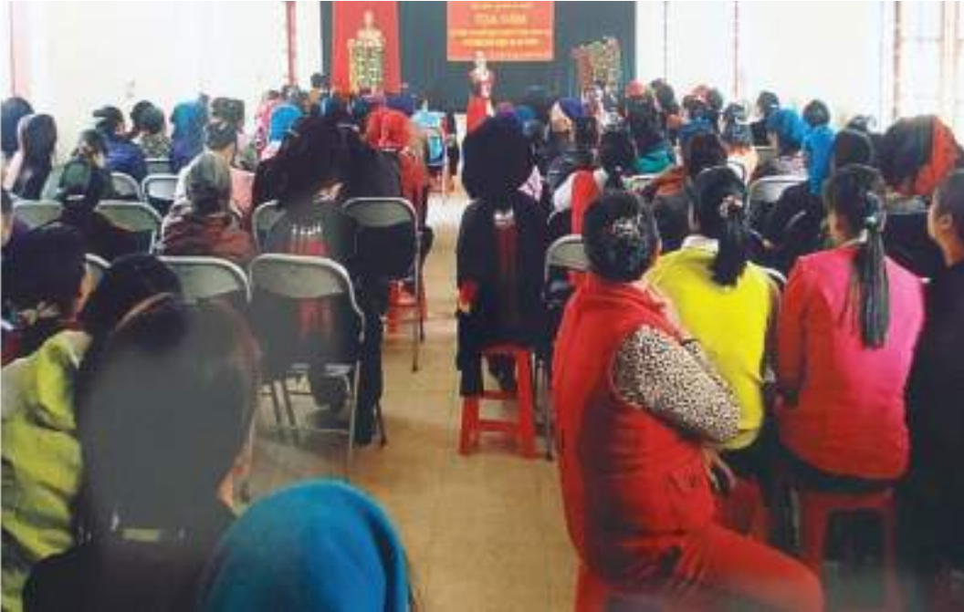
Hội LHPN thị trấn Sìn Hồ, huyện Sìn Hồ, tỉnh Lai Châu Toạ đàm kỷ niệm ngày Quốc tế Phụ nữ 8/3 và khởi nghĩa Hai Bà Trưng

Thành tích nổi bật: Tổ chức tuyên truyền cho hội viên, phụ nữ chấp hành tốt đường lối chủ trương của Đảng, chính sách pháp luật của Nhà nước. Tổ chức triển khai thực hiện phong trào thi đua “Phụ nữ tích cực học tập, lao động sáng tạo, xây dựng gia đình hạnh phúc” và các cuộc vận động thu hút trên 300 lượt hội viên, phụ nữ tham gia. Hội đã vận động chị em hội viên ủng hộ mô hình “Hũ gạo tiết kiệm” được 780kg gạo và 2.000.000đ tiền mặt hỗ trợ cho 50 hộ gia đình hội viên có hoàn cảnh đặc biệt khó khăn trong dịp Tết Nguyên đán hằng năm.