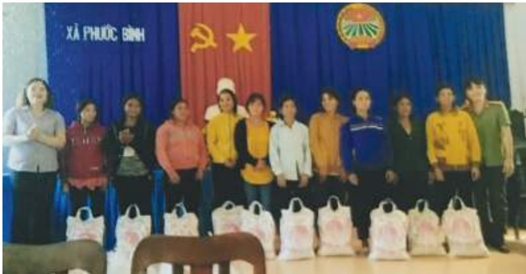
Hội LHPN thành phố Phan Rang - Tháp Chàm phối hợp với Công an tỉnh tặng quà nhân dịp kỷ niệm ngày Thương binh liệt sĩ 27/7

Thành tích nổi bật: Thực hiện có hiệu quả các hoạt động Hội, đóng góp tích cực vào mục tiêu giảm tỷ lệ hộ nghèo của thành phố từ 3,58% (năm 2016) xuống còn 1,97% năm 2019. Từ năm 2016 - 2019, các cấp Hội đã giúp vốn cho 4.951 lượt hộ phụ nữ với số vốn vay trên 113 tỷ đồng; vận động tiết kiệm 54 tỷ 364 triệu đồng giúp 44.469 hội viên, phụ nữ vay; hỗ trợ 411 triệu đồng xây dựng 09 Mái ấm tình thương cho hội viên phụ nữ nghèo, đơn thân, khuyết tật, khó khăn; vận động 2 tỷ 501 triệu đồng, 6 tấn gạo giúp 9.219 lượt phụ nữ khó khăn, neo đơn, gia đình chính sách, học sinh nghèo hiếu học; giúp 128 hộ đạt 8 tiêu chí “gia đình 5 không, 3 sạch”, 86 hộ thoát nghèo theo tiêu chí nghèo đa chiều.