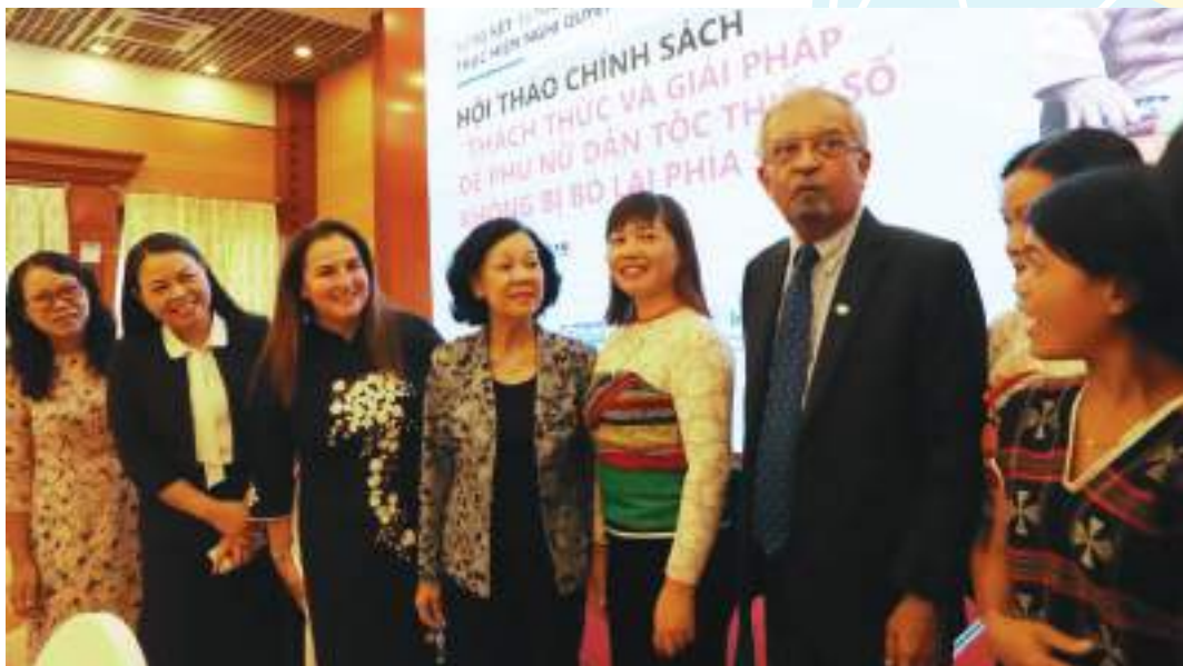
Đồng chí Trương Thị Mai, Ủy viên Bộ Chính trị, Bí thư Trung ương Đảng, Trưởng ban Dân vận Trung ương trao đổi với các đại biểu dự Hội thảo chính sách “Thách thức và giải pháp để phụ nữ dân tộc thiểu số không bị bỏ lại phía sau”