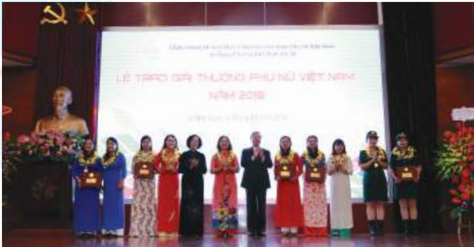
Đồng chí Trần Quốc Vương, Ủy viên Bộ Chính trị, Thường trực Ban Bí thư Trung ương; đồng chí Trương Thị Mai, Ủy viên Bộ Chính trị, Bí thư Trung ương Đảng, Trưởng ban Dân vận Trung ương trao giải cho các tập thể đạt Giải thưởng Phụ nữ Việt Nam năm 2018