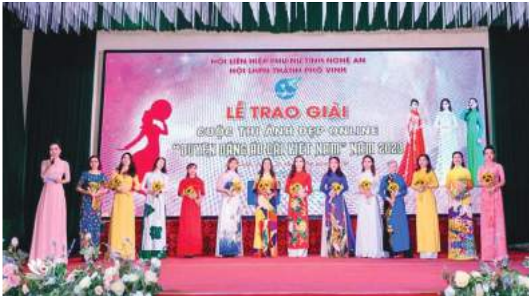
Hội LHPN thành phố Vinh tổ chức trao giải cuộc thi ảnh online “Duyên dáng áo dài Việt Nam” năm 2020

Thành tích nổi bật: Tham mưu ban hành và thực hiện 02 Đề án: Đề án “ Vận động nữ cán bộ, công chức, viên chức, người lao động trên địa bàn tham gia sinh hoạt Hội phụ nữ tại cộng đồng nơi cư trú giai đoạn 2018 - 2021 ” đến nay có 48 mô hình được triển khai ở 25/25 cơ sở Hội, nâng tỷ lệ thu hút hội viên cán bộ, công chức, viên chức tham gia sinh hoạt hội lên 46%; Đề án “ Vận động hội viên phụ nữ phân loại rác thải tại nguồn tại 9 xã ngoại thành, thành phố Vinh giai đoạn 2019 - 2022 ” đến nay có 12.300 gia đình hội viên thống nhất xây dựng và đưa vào sử dụng bể phân hủy rác thải. Tổ chức nhiều hoạt động thực hiện chủ đề năm “ An toàn cho phụ nữ và trẻ em ”: Truyền thông phòng chống ma túy cho học sinh trường THCS; tổ chức diễn đàn “ Phòng chống bạo lực học đường và quấy rối tình dục nơi công cộng ”; thành lập CLB “ Hỗ trợ pháp lý cho hội viên, phụ nữ ”. 100% cơ sở Hội xây dựng ít nhất loại hình văn hóa, văn nghệ, thể dục thể thao với 393 CLB thể dục thể thao và 13 CLB văn nghệ quần chúng, đặc biệt thành lập CLB Thời sự Hội Phụ nữ thành phố với 55 thành viên.