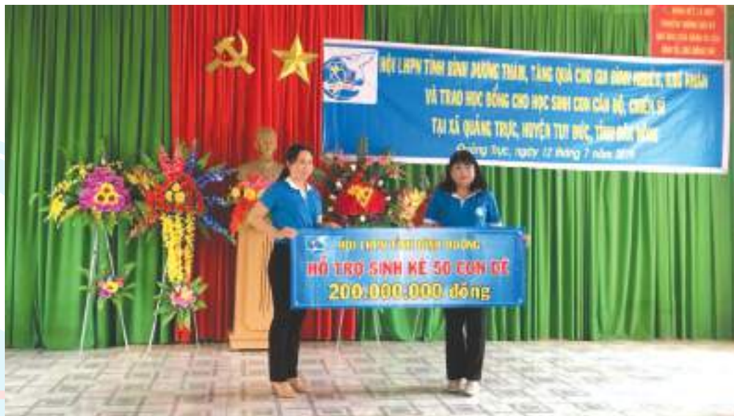
Chủ tịch Hội LHPN tỉnh Bình Dương trao hỗ trợ sinh kế trong chương trình Đồng hành cùng phụ nữ biên cương năm 2019

Thành tích nổi bật: Có nhiều mô hình hoạt động hiệu quả tiêu biểu như “Nuôi heo đất tiết kiệm mua BHYT” đã giúp 4.375 cán bộ Hội; mô hình “Chi hội kiểu mẫu”, “Đồng hành cùng hội viên phụ nữ”, “Chi hội chủ động công tác”. Kết hợp nguồn lực từ các đề án, dự án, chương trình để chăm lo đời sống vật chất và tinh thần cho phụ nữ; hỗ trợ, giúp đỡ 190 chị khởi nghiệp thành công; phối hợp đào tạo nghề, giới thiệu việc làm cho 17.238 chị; đã giúp gần 133.550 lượt chị vay vốn với số tiền 313 tỷ đồng; Gần 4 tỷ đồng thực hiện chương trình “Đồng hành cùng phụ nữ biên cương” giai đoạn 2018 - 2020 hỗ trợ phụ nữ, trẻ em nghèo các tỉnh biên giới Đắc Nông, Bình Phước, An Giang, Đắc Lắc; sửa chữa 129 căn nhà đại đoàn kết, Mái ấm tình thương; hỗ trợ đối tượng xã hội, nhóm người yếu thế, chăm lo cho phụ nữ, trẻ em... trị giá gần 30 tỷ đồng.