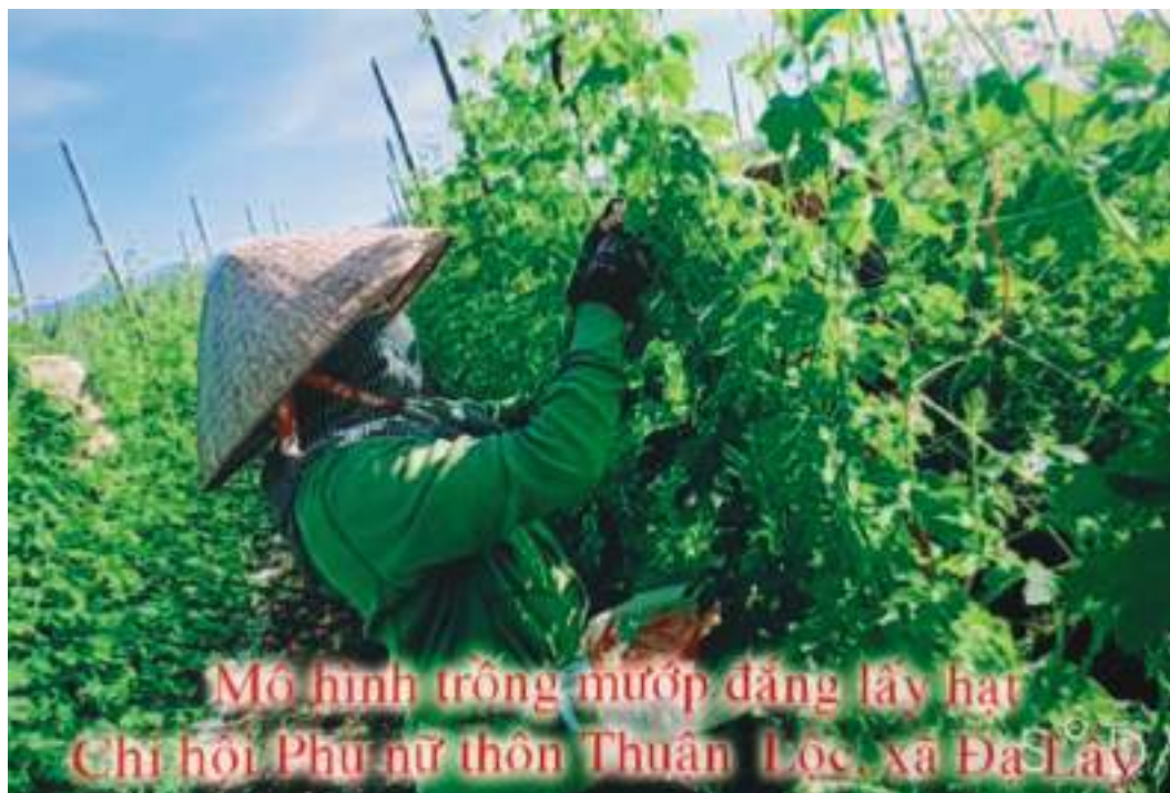
Mô hình trồng mướp đắng lấy hạt Chi hội Phụ nữ thôn Thuận Lộc, xã Đạ Lây