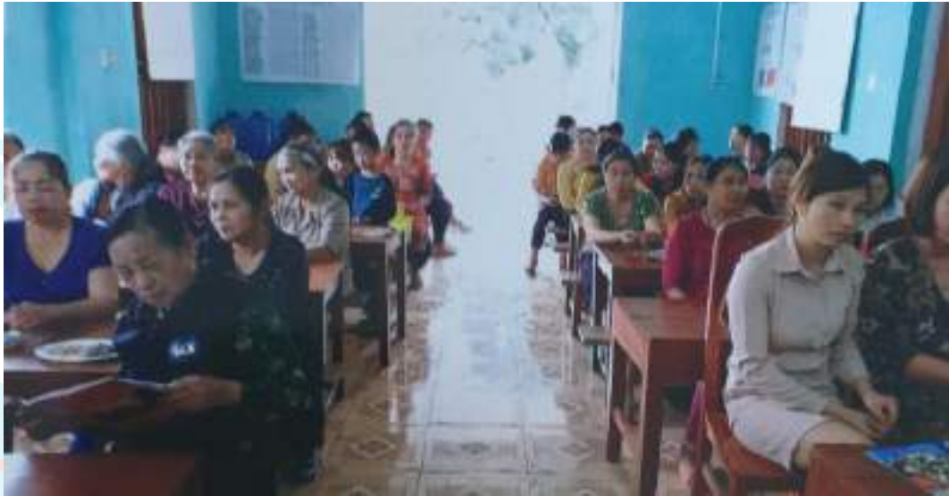
Sinh hoạt Chi hội phụ nữ số 20, xã Đức Ninh, huyện Hàm Yên, tỉnh Tuyên Quang

Thành tích nổi bật: Hướng dẫn 100% cán bộ, hội viên đăng ký phần việc mới hưởng ứng Phong trào thi đua “Phụ nữ tích cực học tập, lao động sáng tạo, xây dựng gia đình hạnh phúc”; đặc biệt quan tâm nội dung “xây dựng gia đình hạnh phúc”; 100% hội viên đăng ký 4 tiêu chuẩn “tự tin, tự trọng, trung hậu, đảm đang”; duy trì hoạt động CLB gia đình hạnh phúc (60 thành viên), 01 mô hình “Tự tin” (40 hội viên); vận động 436 hộ gia đình hội viên (chiếm 93%) tham gia gom rác tại gia đình; trồng và chăm sóc 1.500m đường hoa. Thu hút 3.260 lượt cán bộ, hội viên phụ nữ tham gia sinh hoạt chi hội với nhiều chủ đề.