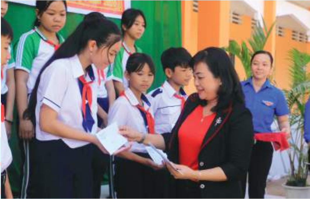
Chủ tịch Hội LHPN tỉnh đang trao học bổng cho học sinh có hoàn cảnh khó khăn trong học tập năm học 2020 - 2021

Thành tích nổi bật: Tập trung công tác nghiên cứu khoa học, đề xuất chính sách: Trong 5 năm, các cấp Hội nghiên cứu 29 đề tài, trong đó Hội LHPN tỉnh đã xây dựng được 5 đề tài khoa học cấp cơ sở và Đề án “Chăm sóc, bảo vệ trẻ em gái tránh bị xâm hại tình dục và hỗ trợ trẻ em bị tổn thương”, giai đoạn 2018 - 2022 được UBND tỉnh phê duyệt. Có nhiều hoạt động hỗ trợ phụ nữ giảm nghèo, phát triển kinh tế: hỗ trợ trên 178 ngàn lượt chị em vay vốn 1.407,4 tỷ đồng; hỗ trợ 5.658 chị tham gia kinh tế hợp tác; tư vấn, giới thiệu, tạo việc làm cho 88.699 lao động nữ nông thôn; hỗ trợ 822 chị phát huy ý tưởng sáng tạo, đầu tư 11,68 tỷ đồng khởi nghiệp. Trong 5 năm, các cấp Hội giúp 7.079 hộ thoát nghèo, trong đó có 2.436 hộ nghèo do phụ nữ làm chủ hộ thoát nghèo. Tích cực tham gia xây dựng nông thôn mới với 416 công trình/phần việc tham gia xây dựng nông thôn mới; vận động 311 hộ gia đình hội viên, phụ nữ hiến trên 995.945m 2 đất, đóng