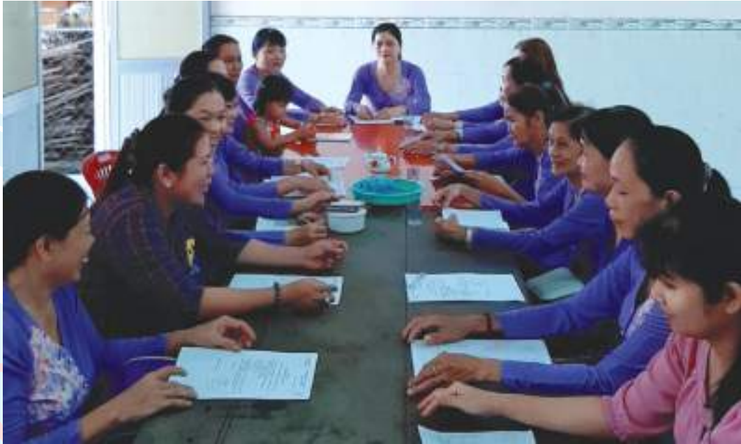
Họp Ban Chấp hành Hội LHPN xã Minh Đức, huyện Mỏ Cày, tỉnh Bến Tre

Thành tích nổi bật: Đơn vị đã có 09 tập thể, 79 cá nhân tiêu biểu trên các lĩnh vực; trồng 06 tuyến đường hoa với chiều dài 2.450m; phối hợp vận động xây dựng mới 06 cầu giao thông kinh phí 150 triệu đồng; 06 Mái ấm tình thương tổng số 180,3 triệu đồng. Duy trì nhiều mô hình, CLB hoạt động hiệu quả như: CLB "Vi tuổi thơ" hàng năm tổ chức trao học bổng, học phẩm và tổ chức trung thu cho các em thiếu nhi, Tổ phụ nữ không có trẻ bỏ học, Tổ phụ nữ không có bạo lực gia đình, Tổ phụ nữ không sinh con thứ ba, 10 tổ phụ nữ phân loại rác thải ở 10 chi hội, CLB gia đình hạnh phúc... Tạo việc làm cho trên 600 lao động nữ thu nhập bình quân hàng tháng từ 3 đến 5 triệu đồng. Năm 2019, vận động được 150 triệu đồng để bê tông hóa tuyến đường dài 380m, ngang 2m; vận động 65 suất học bổng và 1.700 quyển vở tổng trị giá 19 triệu đồng.