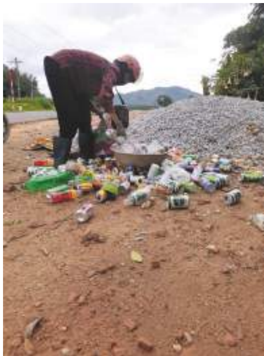
Mô hình biến rác thành tiền của Hội LHPN xã Đăk Dục, huyện Ngọc Hồi

Thành tích nổi bật: Thực hiện cuộc vận động "Xây dựng gia đình 5 không, 3 sạch" đã giúp đỡ được 350 hộ gia đình đạt 8 tiêu chí của cuộc vận động: có 27 hộ nghèo do phụ nữ làm chủ hộ thoát nghèo theo tiêu chí đa chiều; hỗ trợ xây dựng 3 nhà Mái ấm tình thương với số tiền trên 140 triệu đồng; vận động 131 hội viên phụ nữ hiến 1.300m 2 đất làm đường giao thông nông thôn, giao thông nội đồng... Làm tốt việc quản lý nguồn vốn, góp phần nâng dư nợ ủy thác qua Hội Phụ nữ qua 5 năm là 23 tỷ 492 triệu đồng với 2.501 khách hàng, dư tiết kiệm là 3 tỷ 700 triệu đồng. Phát triển và nhân rộng các mô hình: Nuôi heo đen, Nuôi bò sinh sản...; vận động các hội viên trên địa bàn thành lập được 01 hợp tác xã thu mua và tiêu thụ các sản phẩm sạch của hội viên phụ nữ.