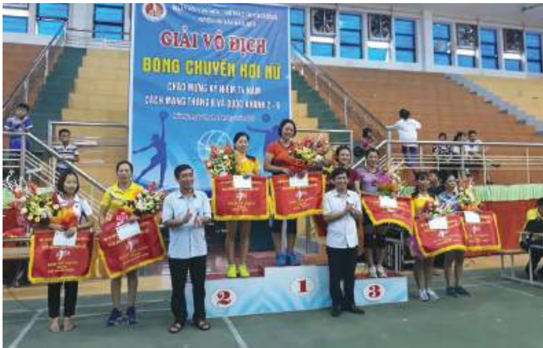
Hội LHPN huyện Hải Hậu tổ chức Giải vô địch bóng chuyền hơi nữ

Thành tích nổi bật: Thực hiện có hiệu quả Cuộc vận động “Xây dựng gia đình 5 không, 3 sạch”, 546 chi hội thành lập mô hình “Chi hội phụ nữ 5 không, 3 sạch”, 34/34 Hội phụ nữ cơ sở giúp gần 629 hộ gia đình đạt 8 tiêu chí của cuộc vận động, đến nay có trên 52.000 hộ gia đình đạt 8 tiêu chí (đạt 94,3%); xây dựng 89 tuyến đường xanh - sạch - đẹp kiểu mẫu do phụ nữ tự quản. Hội tham gia tích cực và đạt giải cao trong các cuộc thi do Trung ương Hội LHPN Việt Nam tổ chức: giải Nhất “Ý tưởng truyền thông về an toàn thực phẩm”; hỗ trợ HTX trồng cây dược liệu Hải Lộc tham gia hội thi “Hương tới nền nông nghiệp sinh thái” năm 2019 do TW Hội LHPN Việt Nam phối hợp Bộ Khoa học và Công nghệ tổ chức, với ý tưởng “Chuyên canh trồng và chế biến cây dược liệu thìa canh nhằm giảm thiểu và thích ứng với biến đổi khí hậu” đã được chọn là 1 trong 46 ý tưởng đạt giải thưởng toàn quốc. Trong 5 năm đã phát triển 3.581 hội viên mới, nâng tổng số hội viên toàn huyện đến nay là 58.540 hội viên đạt tỷ lệ 87,4%.