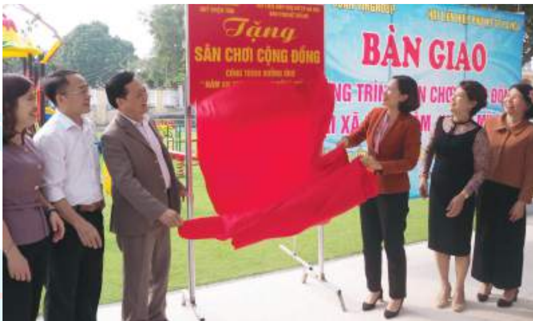
Hội LHPN Hà Nội tặng sân chơi cộng đồng tại xã Đông Tâm, huyện Mỹ Đức tháng 11-2019

Thành tích nổi bật: Thực hiện hiệu quả PTTĐ “Phụ nữ Thủ đô tích cực học tập, lao động sáng tạo, xây dựng gia đình văn minh, hạnh phúc”, cuộc vận động “Xây dựng nông thôn mới, đô thị văn minh”, giúp đỡ 17.854 hộ nghèo, cận nghèo, hoàn cảnh khó khăn thoát nghèo; hỗ trợ 792 phụ nữ khởi sự kinh doanh, khởi nghiệp; xây, sửa 670 Mái ấm tình thương, nhà tình nghĩa; giúp đỡ gần 700 trẻ em chậm tiến có tiến bộ; vận động hiến 13.811m 2 đất làm đường, xây dựng nông thôn mới; đảm nhận 1.543 đoạn đường xanh, sạch, đẹp, nở hoa, 604 điểm sinh hoạt cộng đồng, nhà văn hóa xanh sạch đẹp thân thiện; 366 điểm chân rác được cải tạo thành vườn hoa phụ nữ tự quản...; ủng hộ việc phòng, chống dịch Covid-19 với tổng trị giá 31,85 tỷ đồng; trên 85% hội viên phụ nữ đạt chuẩn mực phụ nữ Thủ đô “Trung hậu, sáng tạo, đảm đang, thanh lịch”; 85% gia đình hội viên đạt “5 không, 3 sạch”. Tỷ lệ thu hút tập hợp hội viên đạt 71%.