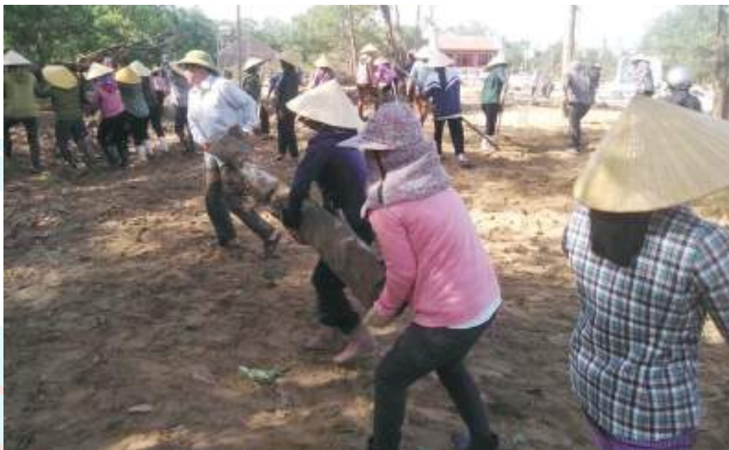
Phụ nữ thôn Châu Long (thôn Công giáo toàn tông), xã Kỳ Châu, huyện Kỳ Anh cải tạo vườn tạp để xây dựng vườn mẫu

Thành tích nổi bật: Thực hiện học tập và làm theo tư tưởng, đạo đức, phong cách Hồ Chí Minh đạt hiệu quả cao, duy trì và nhân rộng 403 mô hình học tập và làm theo gương Bác; huy động tiết kiệm trên 143 tỷ đồng triển khai các hoạt động hỗ trợ phụ nữ khó khăn tại cơ sở duy trì và nhân rộng 403 mô hình học tập và làm theo gương Bác, trong đó có 38 tập thể, cá nhân được biểu dương tại cấp tỉnh; huy động tiết kiệm trên 143 tỷ đồng triển khai các hoạt động hỗ trợ phụ nữ khó khăn tại cơ sở; giúp đỡ 173.577 hộ đạt 8 tiêu chí của cuộc vận động, xây dựng 230 chi hội 5 không, 3 sạch; vận động 70% hộ dân thực hành phân loại rác thải; huy động nguồn lực gần 10 tỷ đồng trao tặng 252 Mái ấm tình thương, 37 mô hình sinh kế; vận động, hỗ trợ phát triển mới 2.745 mô hình kinh tế cho thu nhập trên 100 triệu đồng, 715 vườn mẫu, 581 tổ hợp tác, 98 hợp tác xã; hướng dẫn, hỗ trợ 403 ý tưởng khởi sự kinh doanh và khởi nghiệp; 3 ý tưởng đạt thương hiệu sản phẩm OCOP của tỉnh. Tỷ lệ thu hút tập hợp hội viên đạt 74%.