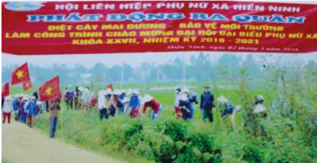
Hội LHPN xã Hiền Ninh, huyện Quảng Ninh ra quân bảo vệ môi trường

Thành tích nổi bật: Tích cực thực hiện Cuộc vận động xây dựng gia đình "5 không, 3 sạch" gắn với "Xây dựng nông thôn mới, đô thị văn minh" bằng 12 phần việc cụ thể. Tiêu biểu như: vận động chị em hiến đất, cây, tài sản, ngày công... trị giá 3,3 tỷ đồng góp phần đưa xã Hiền Ninh về đích nông thôn mới năm 2017; vận động chị em "Phân loại rác thải - Xây dựng hố rác hữu cơ hộ gia đình"; phát động hội viên diệt 32 tấn gốc mai dương, thu gom 15 tấn rác thải làm sạch môi trường; giúp 126 hộ đạt 8 tiêu chí "5 không, 3 sạch"; giúp 7 hộ phụ nữ thoát nghèo theo tiêu chí đa chiều; vận động 375 phụ nữ chuyển đổi 15ha đất trồng lúa một vụ sang "Trồng cây mướp đắng sạch, cà trắng, dưa các loại an toàn" tăng thu nhập từ 50 - 70 triệu đồng/hộ... Hội LHPN xã luôn quan tâm thăm hỏi, tặng 175 suất quà, 120 sổ tiết kiệm cho các mẹ, vợ liệt sĩ, nữ thương binh, thanh niên lên đường nhập ngũ, hội viên khó khăn với trị giá hàng trăm triệu đồng.