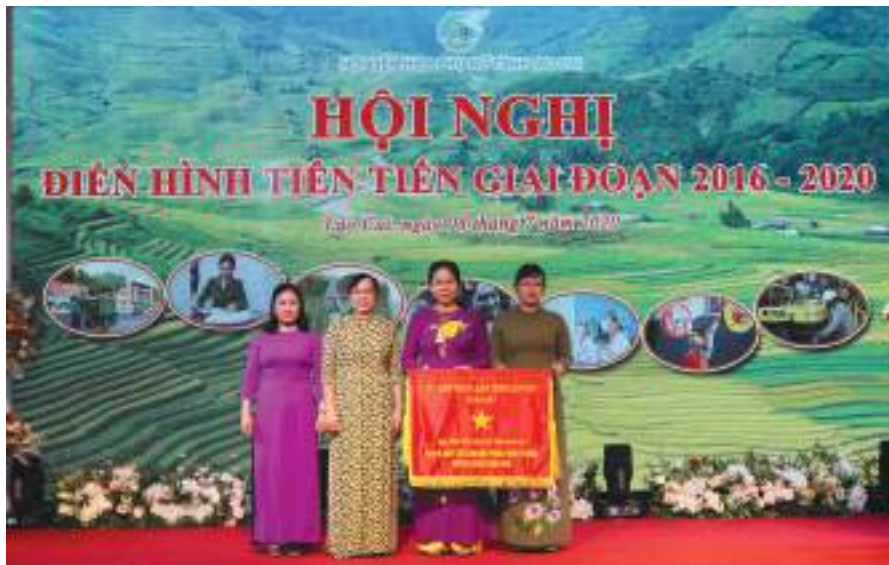
Hội LHPN tỉnh Lào Cai nhận Cờ thi đua xuất sắc của UBND tỉnh năm 2019 tại Hội nghị điển hình tiên tiến giai đoạn 2016 - 2020

Thành tích nổi bật: Tổ chức triển khai thực hiện phong trào thi đua “ Phụ nữ tích cực học tập, lao động sáng tạo, xây dựng gia đình hạnh phúc ”: có 111 cán bộ Hội các cấp đi học đại học, trên đại học; 33 cán bộ học cao cấp, trung cấp LLCT; 5.548 lượt cán bộ được tập huấn nghiệp vụ công tác Hội; 1.174 phụ nữ được đào tạo nghề, 332 phụ nữ có việc làm; phối hợp xóa mù chữ cho 2.144 phụ nữ. Phối hợp tổ chức 425 lớp tập huấn, hội thảo, diễn đàn về giảm nghèo bền vững, khởi sự kinh doanh, tổ chức 02 Ngày phụ nữ khởi nghiệp cấp tỉnh; ủy thác với Ngân hàng CSXH, Ngân hàng Nông nghiệp và Phát triển nông thôn là 1.646,216 tỷ đồng, với 874 tổ tiết kiệm và vay vốn 25.777 hộ dư nợ; hỗ trợ 195 phụ nữ khởi sự kinh doanh, khởi nghiệp; kết nối tiêu thụ sản phẩm cho hội viên, phụ nữ. Nâng cao chất lượng các mô hình “ Phụ nữ giúp nhau phát triển kinh tế gia đình ”. Quan tâm kiện toàn tổ chức bộ máy các cấp Hội; thực hiện tốt công tác đào tạo, tập huấn cho cán bộ Hội; tích cực đổi mới nội dung, phương thức hoạt động để tập hợp hội viên.