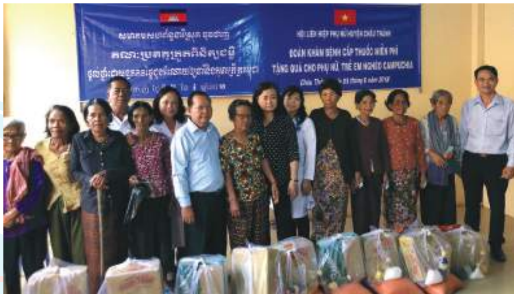
Hội LHPN huyện Châu Thành, tỉnh Tây Ninh tổ chức khám bệnh, cấp thuốc miễn phí và tặng quà cho phụ nữ, trẻ em nghèo Campuchia

Thành tích nổi bật: Điểm mới, sáng tạo trong công tác chỉ đạo triển khai PTTĐ thể hiện qua sự đa dạng về nội dung, chủ đề cụ thể hàng năm gắn với từng thời gian, phù hợp với từng đối tượng phụ nữ. Kết nối chặt chẽ từ phát động, phổ biến nội dung thi đua đến vận động chị em tích cực tham gia thực hiện; coi trọng hướng dẫn, tổ chức các hoạt động hỗ trợ thực hiện, định kỳ kiểm tra đánh giá và bình xét thi đua; chú trọng sơ kết, tổng kết, biểu dương điển hình, phổ biến sáng kiến, kinh nghiệm; tăng cường đẩy mạnh công tác khen thưởng. Hàng năm, 100% cán bộ chuyên trách Hội, cán bộ chi hội, 85% hội viên, phụ nữ, 61% hộ gia đình do phụ nữ làm chủ hộ, 99% bà mẹ và thành viên trong gia đình có con từ 0 - 16 tuổi được cung cấp kiến thức, kỹ năng nuôi, dạy con và được Hội giúp đỡ thông qua các hoạt động thiết thực: tặng quà, tổ chức khám, chữa bệnh, phát thuốc miễn phí, xây tặng Mái ấm tình thương, giúp nhau mua thẻ BHYT, trao học bổng.... Các hoạt động ước tính tổng số tiền trên 119 tỷ đồng. Đã có 11.958 hộ đạt gia đình 5 không, 3 sạch, 5.057 gương hội viên, phụ nữ tiêu biểu trên các lĩnh vực được Hội biểu dương, nhân rộng.