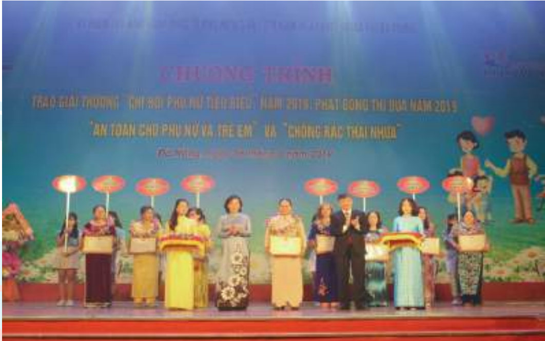
Hội LHPN thành phố Đà Nẵng trao Giải thưởng “Chi hội Phụ nữ tiêu biểu” năm 2018, phát động thi đua năm 2019 “An toàn cho phụ nữ và trẻ em” và “Chống rác thải nhựa”

Thành tích nổi bật: Luôn nỗ lực với nhiều sáng kiến nhằm xây dựng tổ chức Hội vững mạnh, sau 12 năm thực hiện, đến nay đã có 120 Chi hội Phụ nữ đạt Giải thưởng “Chi hội Phụ nữ tiêu biểu”, duy trì tốt các mô hình bảo vệ môi trường: “Sống xanh”, “Trồng hoa và cây xanh vì thành phố Đà Nẵng bền vững về môi trường”; duy trì 717 CLB/nhóm Sống xanh. Thành lập mới 5 hợp tác xã; phát triển mới 16 tổ/nhóm liên kết/dịch vụ nâng tổng số hiện nay là 193 mô hình, giải quyết việc làm thường xuyên cho 2.650 lao động nữ. Tỷ lệ tập hợp hội viên đạt 70%.