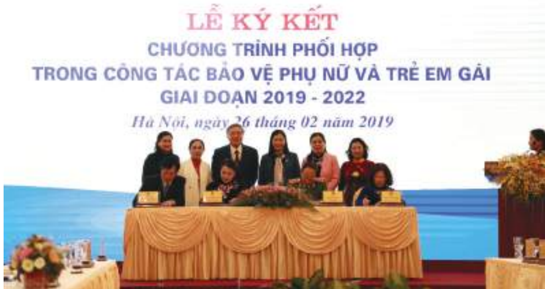
Đồng chí Nguyễn Hòa Bình, Bí thư Trung ương Đảng, Chánh án Tòa án nhân dân tối cao chứng kiến Lễ ký kết Chương trình phối hợp giữa Trung ương Hội LHPN Việt Nam, Tòa án nhân dân tối cao, Viện Kiểm sát nhân dân tối cao và Bộ Công an trong công tác bảo vệ phụ nữ và trẻ em gái giai đoạn 2019 - 2022