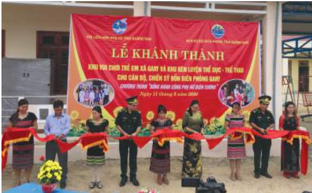
Hội LHPN tỉnh phối hợp với Bộ đội Đồn Biên phòng tỉnh trao tặng khu vui chơi cho trẻ em xã Gary và khu rèn luyện thể dục - thể thao cho cán bộ chiến sĩ Đồn Biên phòng Gary

Thành tích nổi bật: Tuyên truyền vận động thực hành tiết kiệm theo gương Bác ủng hộ Chương trình “ Đồng hành cùng phụ nữ biên cương ” với cách làm sáng tạo, hiệu quả: mỗi cán bộ, hội viên, phụ nữ ủng hộ ít nhất 11.000đ/người/3 năm, tổng số tiền ủng hộ gần 3,39 tỷ đồng hỗ trợ xây dựng 33 nhà tình thương và các mô hình hỗ trợ phụ nữ phát triển kinh tế vùng biên. Các mô hình phụ nữ tiết kiệm đã vận động 134 tỷ đồng hỗ trợ phương tiện sinh kế cho 19.000 lượt hội viên, phụ nữ nghèo; vận động 27,6 tỷ đồng hỗ trợ xây dựng 344 nhà và sửa chữa 128 nhà cho phụ nữ nghèo; giúp 3.008 hộ phụ nữ thoát nghèo, góp phần giảm tỷ lệ hộ nghèo toàn tỉnh từ 12,9% (năm 2015) xuống còn 6,06% (năm 2019). Tuyên truyền, vận động hội viên, phụ nữ ủng hộ phòng chống dịch bệnh Covid-19 với số tiền, quà trị giá trên 3 tỷ đồng. Toàn tỉnh có trên 3.000 mô hình, điển hình, cách làm hay được biểu dương, tuyên truyền, nhân rộng; tỷ lệ tập hợp hội viên đạt trên 70%.