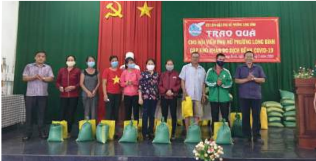
Hội LHPN phường Long Bình, thành phố Biên Hòa, tỉnh Đồng Nai trao quà cho hội viên, phụ nữ phường gặp khó khăn trong dịch Covid-19

Thành tích nổi bật: Thành lập 293 tổ phụ nữ “5 không, 3 sạch” có 5.779 hội viên tham gia, 13 tuyến đường phụ nữ tự quản về “Xanh - Sạch - Đẹp” có 754 hội viên tham gia; tổ chức vận động các hộ dân đóng góp mua thùng rác công cộng trị giá 30.000.000đ; thành lập 10 tổ phụ nữ công nhân nhà trọ với 280 hội viên. Thực hiện phong trào nuôi heo đất hàng năm tiết kiệm từ 1 đến 2 tỷ đồng; cùng Hội LHPN thành phố xây dựng 3 căn nhà tình thương cho hội viên nghèo trị giá 50 triệu đồng; trao học bổng “Nguyễn Thị Định” 389 suất và 5.420 phần quà học tập; vận động 235 chị tham gia phong trào hiến máu nhân đạo; duy trì hoạt động của 12 CLB; phối hợp tổ chức được 10 lớp dạy nghề miễn phí cho 350 chị tham gia. Vận động chị em may 20.000 khẩu trang vải, tặng 880 phần quà trị giá 106.900.000 đồng cho chị em chịu ảnh hưởng của đại dịch Covid-19.