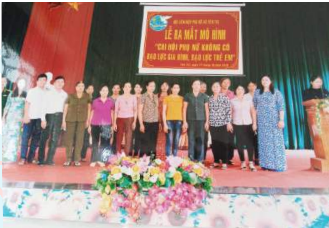
Lễ ra mắt mô hình “Chi hội không có bạo lực gia đình, bạo lực trẻ em” tại xã Yên Trị, huyện Yên Thủy, tỉnh Hòa Bình

Thành tích nổi bật: Tổ chức 02 hội thi tìm hiểu kiến thức pháp luật, 02 hội thi gia đình hạnh phúc, 07 hội thảo về vệ sinh an toàn thực phẩm, 01 hội thảo về nạn xâm hại trẻ em gái, 03 lớp dạy nghề kỹ thuật trồng cây có múi cho 105 hội viên, 07 lớp may công nghiệp cho 235 hội viên; thành lập 61 mô hình, CLB, địa chỉ tin cậy; tuyên truyền vận động phong trào “Giúp phụ nữ nghèo có địa chỉ”, vận động cán bộ hội viên giúp tiền mặt, ngày công, con giống... trị giá 57.040.000đ giúp 35 hội viên gặp rủi ro, phát triển kinh tế.