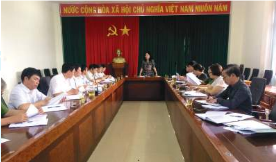
Hội LHPN tỉnh Đắk Lắk giám sát Luật phòng chống bạo lực gia đình tại huyện Cư Kuin

Thành tích nổi bật: Thực hiện có hiệu quả Đề án “Hỗ trợ phụ nữ khởi nghiệp”, hỗ trợ 3.185 phụ nữ khởi nghiệp, khởi sự kinh doanh vay vốn ưu đãi với số tiền 41,3 tỷ đồng, hỗ trợ các thủ tục pháp lý thành lập 16 hợp tác xã do phụ nữ quản lý. Tuyên truyền, vận động, hỗ trợ phụ nữ “xây dựng gia đình 5 không, 3 sạch” gắn với thực hiện các tiêu chí xây dựng nông thôn mới với 1.323 mô hình “Con đường phụ nữ tự quản”, “đường hoa phụ nữ”; 27 mô hình “Chi hội phụ nữ 5 không, 3 sạch”, 24 mô hình chi hội 3 an toàn và 584 mô hình, CLB về dịch vụ hỗ trợ phụ nữ và gia đình... Vận động trên 87 tỷ đồng, 122.000 ngày công lao động, hiến 103.536m 2 đất để xây dựng đường giao thông nông thôn, thắp sáng điện đường, xây dựng các công trình sinh hoạt cộng đồng thôn, buôn. Tỷ lệ tập hợp hội viên đạt 64,3%.