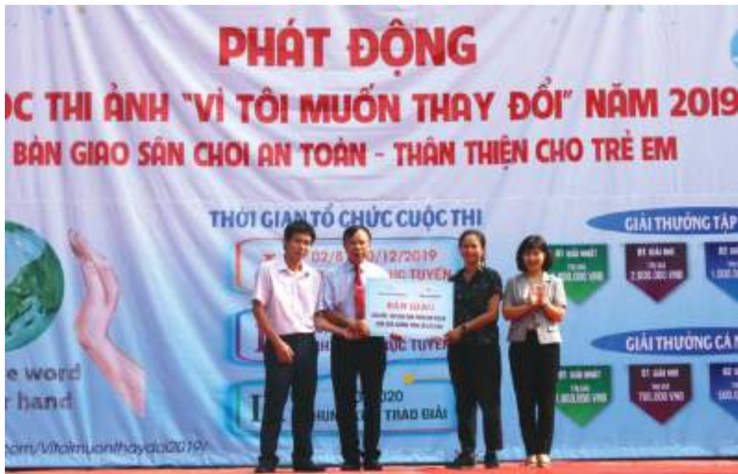
Hội LHPN huyện Đông Anh, Hà Nội phát động cuộc thi ảnh "Vì tôi muốn thay đổi", trao tặng kinh phí xây dựng sân chơi cho trẻ em.

Thành tích nổi bật: Luôn chủ động, sáng tạo trong cách thức triển khai, thực hiện nhiệm vụ: thực hiện tốt chủ đề năm “An toàn cho phụ nữ và trẻ em”, nổi bật là đợt thi đua đặc biệt năm 2020, chủ đề “90 hành động thiết thực vì phụ nữ và trẻ em gắn với phát triển cộng đồng” với 29 hành động cấp huyện và 61 hành động cấp cơ sở; vận động xây dựng và bàn giao sân chơi cộng đồng trị giá gần 2 tỷ đồng. Hoạt động truyền thông có nhiều sáng tạo, ấn tượng: phát hành 240.000 tờ rơi, tờ gấp, 38 clip, phóng sự, 50 pano, áp phích, 2 bộ xếp chữ, 20 tiểu phẩm, sân khấu hóa... Phát hiện, bồi dưỡng, nhân rộng 340 tập thể, cá nhân điển hình tiên tiến.