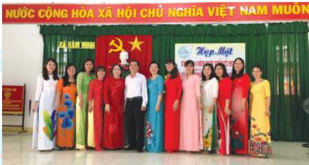
Hội LHPN xã Hàm Minh, huyện Hàm Thuận Nam tổ chức gặp mặt nhân ngày Quốc tế Phụ nữ 8-3

Thành tích nổi bật: Thực hiện tốt cuộc vận động: “Xây dựng gia đình 5 không 3 sạch”: hỗ trợ xây mới 04 Mái ấm tình thương cho hội viên, phụ nữ nghèo, khó khăn, tổng số tiền 157,5 triệu đồng; thực hiện công trình thi đua “Xanh - Sạch - Đẹp” chào mừng Đại hội Đảng các cấp, tổng kinh phí 31,8 triệu đồng; vận động 137 hộ dân đóng góp được tổng số tiền trên 106 triệu đồng làm hệ thống đèn chiếu sáng 04 tuyến đường giao thông nông thôn với chiều dài 3.317m/87 bóng điện thấp sáng, có 1.730 hộ gia đình đạt 8 tiêu chí. Xây dựng và nhân rộng nhiều mô hình bảo vệ môi trường hiệu quả: mô hình “Mỗi gia đình hội viên phụ nữ có 01 sọt đựng rác”; “Tổ phụ nữ đảm bảo vệ sinh môi trường tại khu vực chợ 23”, có 35 hội viên tiểu thương đã đóng góp 12,2 triệu đồng mua 10 thùng rác để gom rác thải. Vận động hội viên, phụ nữ tham gia tiết kiệm với tổng số tiền trên 2,9 tỷ đồng giúp 889 chị em. Vận động 304.505.000 đồng, 2.700kg gạo làm công tác từ thiện nhân đạo, giúp các chị em phụ nữ,... Khai thác các nguồn