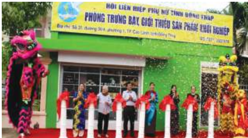
Khai trương Phòng trưng bày, giới thiệu sản phẩm khởi nghiệp của phụ nữ Đồng Tháp

Thành tích nổi bật: Duy trì và phát huy hiệu quả các mô hình như: “Tiết kiệm theo gương Bác”, “Hùn vốn mua bảo hiểm y tế”, “Hùn vốn xây nhà”; Tổ “Tiết kiệm nuôi heo đất”... Hội phối hợp vận động xây dựng mới 106 cây cầu với số tiền 19.991.231.000 đồng và sửa chữa 16 cầu nông thôn với số tiền 275.000.000 đồng; phối hợp vận động nhân dân hiến 170.430m 2 đất xây dựng các công trình phục vụ nông thôn mới trị giá 11.689.344.000 đồng; Duy trì và nhân rộng mô hình “Ngày 3 sạch”, “Đoạn đường 3 sạch”, “Đoạn đường nông thôn mới kiểu mẫu”... với tổng chiều dài 799,67 km; tổ chức phát động phong trào “Chống rác thải nhựa” trong hệ thống Hội, xây dựng mô hình điểm “Sông không rác”. Phong trào thi đua khởi nghiệp của phụ nữ tỉnh Đồng Tháp được ghi nhận và đánh giá cao, được UBND tỉnh chọn làm phong trào chuyên đề phát động toàn tỉnh; hỗ trợ 3.245 hộ nghèo thoát nghèo, góp phần giảm tỷ lệ hội viên, phụ nữ nghèo hàng năm giảm bình quân 2,25%; hỗ trợ xây dựng mới và sửa chữa 782 Mái ấm tình thương tổng trị giá trên 22,3 tỷ đồng cho hội viên, phụ nữ; hỗ trợ cho hội viên phụ nữ khó khăn trị giá trên 10 tỷ đồng. Tỷ lệ tập hợp, thu hút hội viên đạt 53,09%.