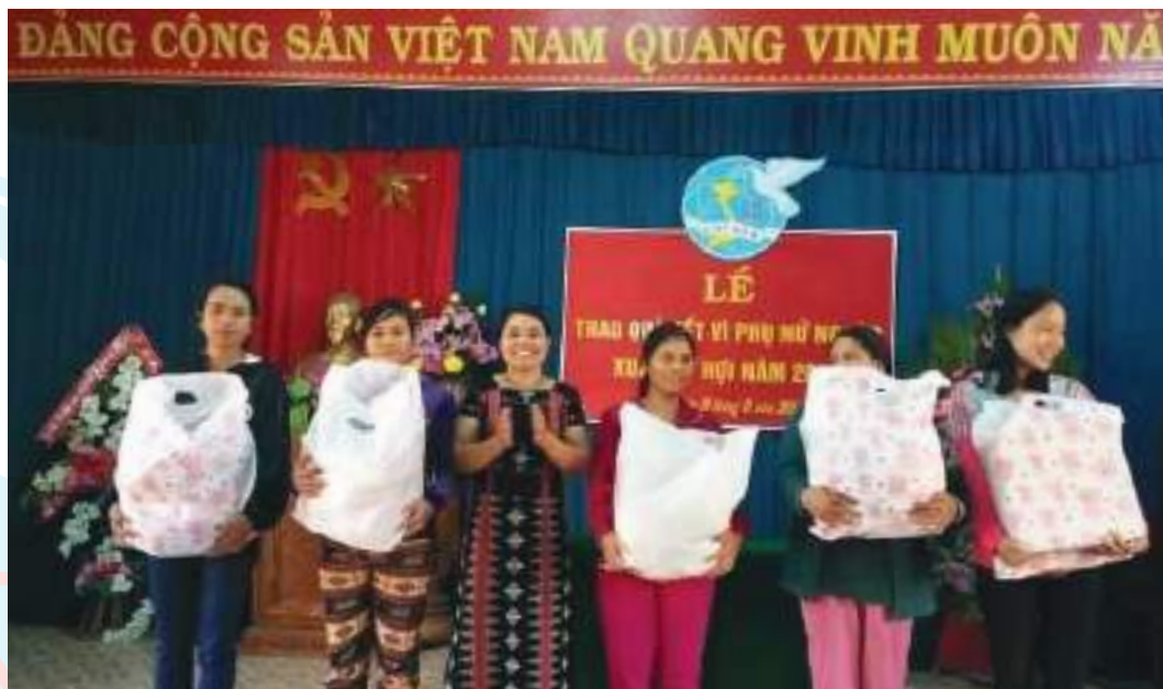
Hội LHPN xã A Ngo, huyện A Lưới trao quà Tết Nguyên đán cho phụ nữ có hoàn cảnh khó khăn

Thành tích nổi bật: Xuất sắc dẫn đầu phong trào thi đua của Hội về công tác bảo vệ môi trường, nói không với túi nilon và sản phẩm nhựa sử dụng một lần, xây dựng gia đình 5 không, 3 sạch với nhiều mô hình tiêu biểu. Đã vận động cán bộ, hội viên giúp đỡ 23 hộ gia đình nghèo, khó khăn trong địa bàn xã bằng 4.667 lon gạo tình thương, 551 gói củi, 457 ngày công, 50 triệu đồng tiền mặt. Làm tốt công tác tín dụng vốn vay Ngân hàng CSXH không bị lãi tồn và nợ quá hạn, hệ thống sổ sách khoa học, quản lý trên 10 tỷ đồng/365 thành viên/07 tổ, liên kết với huyện Hội và Ngân hàng Liên Việt PostBank quản lý tổng dư nợ trên 2 tỷ đồng với 56 thành viên/01 tổ.