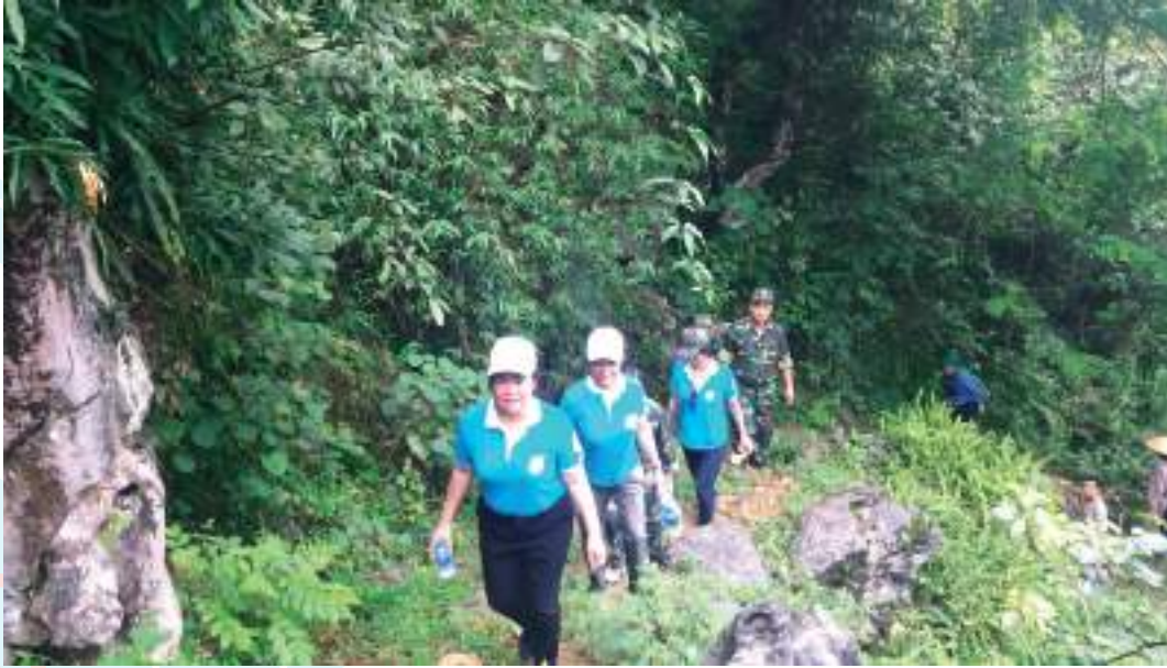
Cán bộ Hội LHPN tỉnh, hội viên phụ nữ xã Đàm Thủy và chiến sĩ đồn Biên phòng Đàm Thủy, huyện Trùng Khánh, tỉnh Cao Bằng tuần tra đường biên, mốc giới

Thành tích nổi bật: Tổ chức tốt việc tuyên truyền chủ trương, đường lối chính sách của Đảng, pháp luật của Nhà nước; nội dung 3 văn kiện pháp lý về biên giới đất liền; hướng dẫn, giới thiệu vị trí lịch sử các dấu hiệu trên thực địa của đường biên, cột mốc trong phạm vi xóm tự quản... cho hơn 3.000 lượt hội viên, phụ nữ. Xây dựng và nhân rộng mô hình phụ nữ tự quản đường biên, cột mốc; thành lập 18 Tổ “Tự quản đường biên mốc giới” với 317 chị tham gia. Trong 5 năm, các tổ đã nắm bắt và cung cấp nhiều thông tin quan trọng, trong đó 8 tin có giá trị cho lãnh đạo cấp ủy Đảng; giúp tổ công tác Biên phòng phát hiện, ngăn chặn, xử lý 4 vụ (gồm 5 đối tượng) vi phạm, góp phần giữ vững an ninh trật tự trên địa bàn.