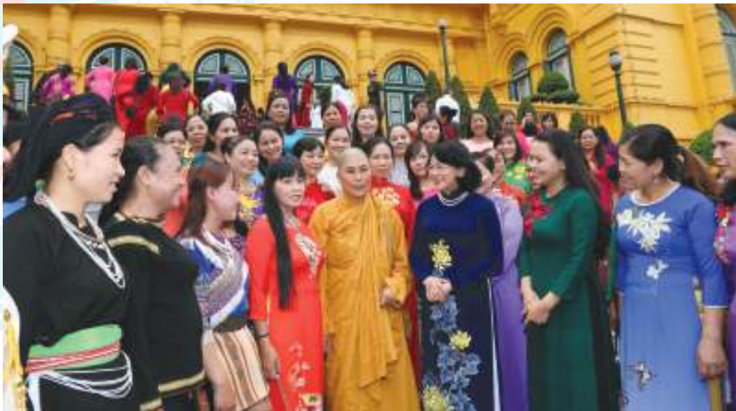
Phó Chủ tịch nước Đặng Thị Ngọc Thịnh tiếp Đoàn đại biểu các tập thể, hộ gia đình, cá nhân phụ nữ tiêu biểu xuất sắc về dự Hội nghị biểu dương các nữ điển hình tiên tiến toàn quốc thực hiện Chỉ thị số 05 - CT/TƯ về đẩy mạnh học tập và làm theo tư tưởng, đạo đức, phong cách Hồ Chí Minh và phong trào “ Cả nước chung sức xây dựng nông thôn mới giai đoạn 2016 - 2020 ” tại Thủ đô Hà Nội