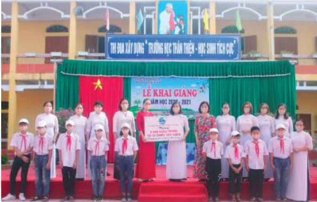
Hội LHPN phường Tân Dân, thành phố Chí Linh, tỉnh Hải Dương tặng khẩu trang và cặp sách cho học sinh nhân dịp khai giảng năm học mới 2020 - 2021

Thành tích nổi bật: Thực hiện tốt công tác nhân đạo từ thiện, vận động quyên góp ủng hộ xây dựng 4 nhà Mái ấm tình thương tặng cho hội viên phụ nữ có hoàn cảnh đặc biệt khó khăn với số tiền 287.025.000 đồng; phát động quyên góp xây dựng quỹ trẻ thơ của phường được 30.000.000 đồng để giúp đỡ trẻ em nghèo, có hoàn cảnh đặc biệt khó khăn; vận động hội viên dùng làn nhựa đi chợ để giảm thiểu việc sử dụng túi nilon gây ô nhiễm môi trường. Tích cực tham gia phòng chống dịch Covid-19: cử 37 cán bộ Hội tham gia phòng chống dịch, vận động ủng hộ 2.250 chiếc khẩu trang y tế, 200 chai nước sát khuẩn tặng cho hội viên và nhân dân, phát 650 tờ rơi tuyên truyền, thành lập “Bếp ăn dã chiến” nấu ăn phục vụ 50 suất ăn/ngày cho 6 chốt kiểm soát dịch...