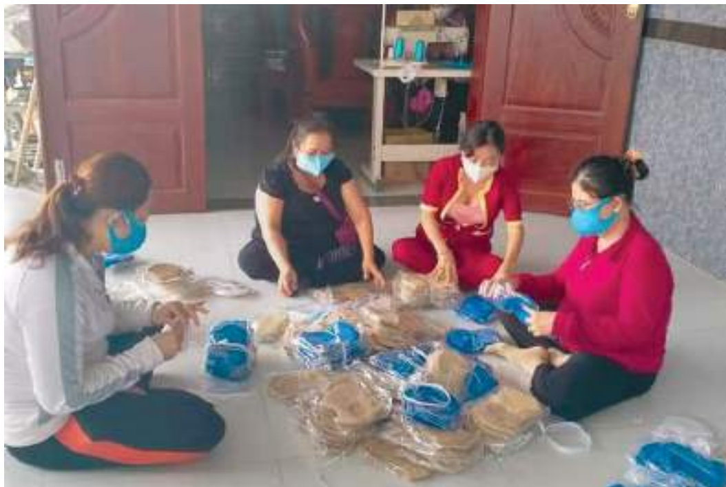
Hội LHPN xã Mỹ Hạnh Nam, huyện Đức Hòa, tỉnh Long An chuẩn bị khẩu trang tặng hội viên, phụ nữ phòng chống Covid-19

Thành tích nổi bật: Duy trì, nhân rộng nhiều mô hình hoạt động hiệu quả: mô hình “Tuyến đường không rác”, mô hình “Áo trắng học đường”, mô hình “Tiết kiệm tín dụng”, đặc biệt là mô hình CLB công nhân nhà trọ được duy trì gần 13 năm tạo sân chơi giải trí lành mạnh cho nữ công nhân nhà trọ góp phần giảm tệ nạn xã hội và ổn định an toàn trật tự ở địa phương. Hội làm tốt công tác xã hội từ thiện: trong 5 năm qua, vận động hỗ trợ hộ nghèo, hộ cận nghèo, hộ có hoàn cảnh khó khăn, học sinh nghèo, có hoàn cảnh khó khăn hơn 1.000 phần quà nhu yếu phẩm, 453 bộ sách giáo khoa, 4.500 quyển vở với tổng số tiền 193 triệu đồng; vận động xây dựng 06 căn nhà tình thương với số tiền 240 triệu đồng. Với các hoạt động chăm lo thiết thực quyền lợi của phụ nữ, Hội đã phát triển được 4 tổ phụ nữ với gần 90 hội viên, nâng