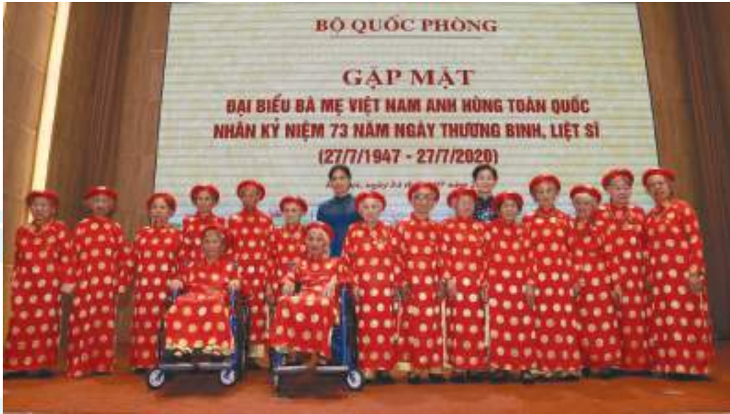
Chủ tịch Hội LHPN Việt Nam Hà Thị Nga và Phó Chủ tịch Hội LHPN Việt Nam Trần Thị Hương tặng quà và cùng chụp ảnh lưu niệm với các Mẹ Việt Nam anh hùng