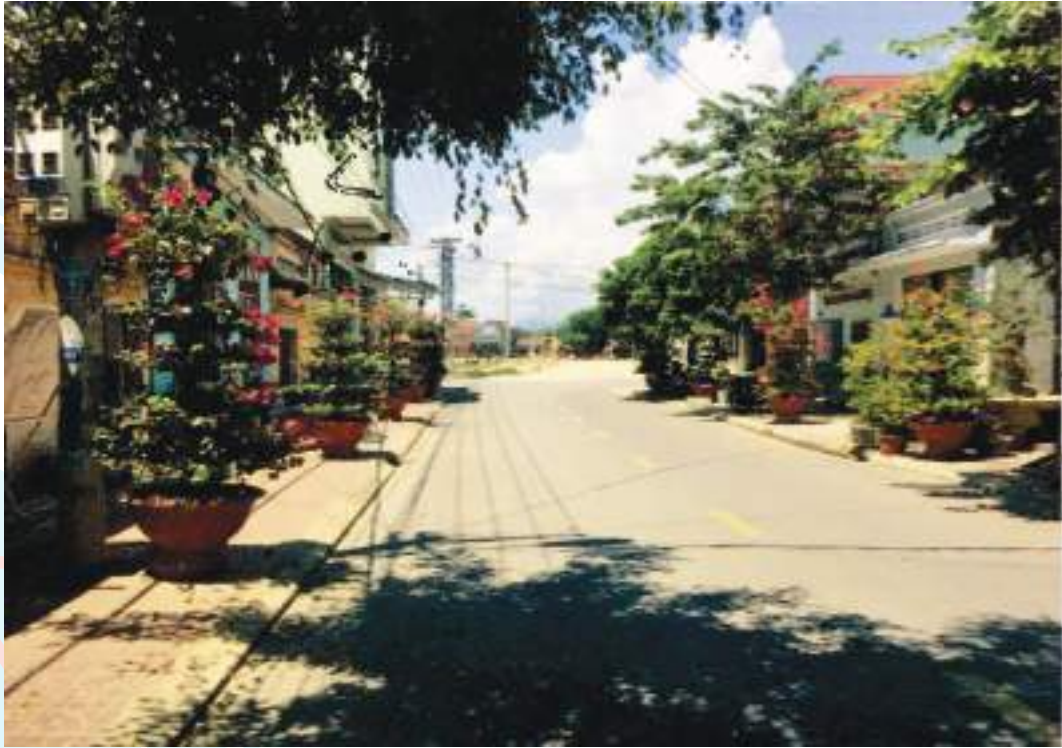
Một góc tuyến đường hoa giấy thôn An Thái, xã Nhơn Phúc, thị xã An Nhơn, tỉnh Bình Định

Thành tích nổi bật: Thực hiện hiệu quả phong trào “Đường hoa do phụ nữ chăm” góp phần thực hiện tiêu chí “3 sạch” và tham gia xây dựng nông thôn mới. Xây dựng được 21 tuyến đường hoa với 1.021 chậu (trên 7.000m) hoa giấy và trên 8.000m đường hoa Mười giờ, hoa Hoàng yến với tổng kinh phí gần 369 triệu đồng. Xây dựng và duy trì hiệu quả 28 mô hình ở 15 cơ sở Hội, góp phần giữ gìn môi trường đường làng, ngõ xóm xanh, sạch, đẹp. Đến nay, phong trào đang lan tỏa đến cán bộ, hội viên phụ nữ và nhân dân trên địa bàn thị xã, góp phần đưa thị xã đạt chuẩn đô thị loại 3 vào năm 2021 và trở thành thành phố vào năm 2025.