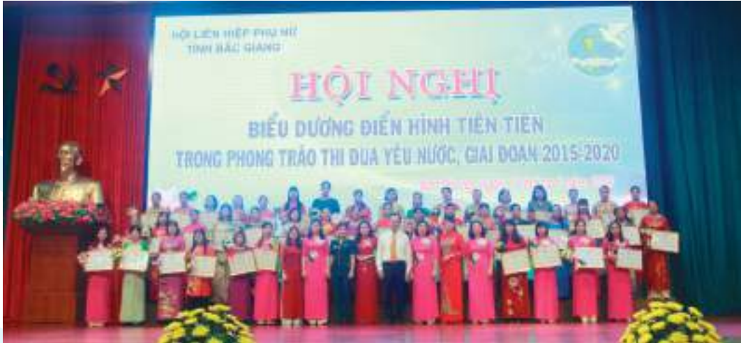
Hội LHPN tỉnh Bắc Giang tổ chức Hội nghị biểu dương điển hình tiên tiến trong Phong trào thi đua yêu nước, giai đoạn 2015 - 2020

Thành tích nổi bật: Trong 5 năm, đã đăng ký thực hiện 883 công trình/hoạt động/phần việc thiết thực xây dựng nông thôn mới, vận động hội viên phụ nữ thu gom, bán rác tái chế và tiết kiệm từ các mô hình "làm theo" Bác được trên 35 tỷ đồng và 59 tấn gạo giúp phụ nữ, trẻ em nghèo, có hoàn cảnh khó khăn. Hỗ trợ phụ nữ vay vốn với số tiền 2.800 tỉ đồng và đẩy mạnh phong trào phụ nữ giúp phụ nữ giống, vốn trên 370 tỷ đồng; vận động, hỗ trợ xây 280 Mái ấm tình thương; hỗ trợ thành lập 09 hợp tác xã, 85 tổ hợp tác/tổ liên kết; hỗ trợ 838 phụ nữ khởi sự/khởi nghiệp thành công; giúp 4.088 hộ nghèo do phụ nữ làm chủ thoát nghèo bền vững; can thiệp giải quyết 299 vụ việc phụ nữ, trẻ em bị xâm hại, bạo lực, tai nạn thương tích, rủi ro; tổ chức 261 diễn đàn đối thoại giữa cán bộ, hội viên phụ nữ với các đồng chí lãnh đạo cấp ủy, chính quyền địa phương; giám sát 10 chính sách liên quan đến phụ nữ; đề xuất 26 cơ chế/chính sách/kế hoạch liên quan phụ nữ, trẻ em...; huy động các nguồn lực hỗ trợ trang bị máy tính cho 103 cơ sở, đến nay 100% cơ sở Hội có máy tính riêng. Tỷ lệ thu hút tập hợp hội viên đạt 79,6 %.