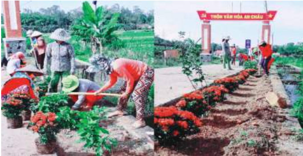
Mô hình Đoạn đường hoa của Hội LHPN thị trấn Châu Ổ, huyện Bình Sơn, tỉnh Quảng Ngãi

Thành tích nổi bật: Có nhiều hoạt động hiệu quả trong tham gia xây dựng nông thôn mới: vận động hội viên, phụ nữ trồng được 08 đoạn đường hoa, 85 hộ thực hiện thấp sáng đường quê, tháo dỡ 2.500 tường rào bê tông, hiến 23.000m 2 đất, hơn 1.000 ngày công và đóng góp 01 tỷ đồng để làm đường bê tông liên xã, thành lập mới 05 mô hình phụ nữ giữ gìn vệ sinh môi trường. Hội nhận đỡ đầu thường xuyên 02 trẻ em mồ côi với tổng số tiền hỗ trợ là 24 triệu đồng; thăm và tặng quà cho 61 trẻ em có hoàn cảnh khó khăn và 16 gia đình chính sách với tổng số tiền gần 84 triệu đồng. Vận động chị em tham gia thực hành tiết kiệm theo Bác được gần 500 triệu đồng, giúp đỡ được 239 hội viên khó khăn, 160 hộ thoát nghèo; tư vấn, giới thiệu việc làm cho 09 phụ nữ. Tư vấn được 18 trường hợp bị bạo lực gia đình và các tệ nạn xã hội; phát hiện và kịp thời báo cơ quan chức năng xử lý 06 trường hợp đánh bạc. Trong 5 năm đã phát hiện và giới thiệu với Hội cấp trên được 11 gương điển hình tiên tiến.