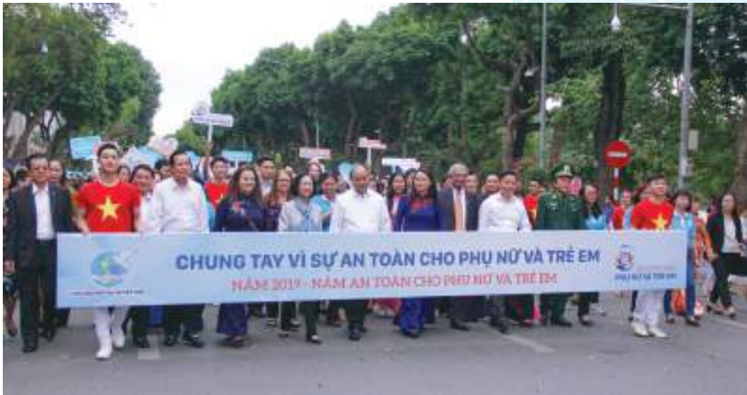
Thủ tướng Chính phủ Nguyễn Xuân Phúc cùng đại biểu ban, bộ, ngành tham dự Lễ phát động "Năm an toàn cho phụ nữ và trẻ em"