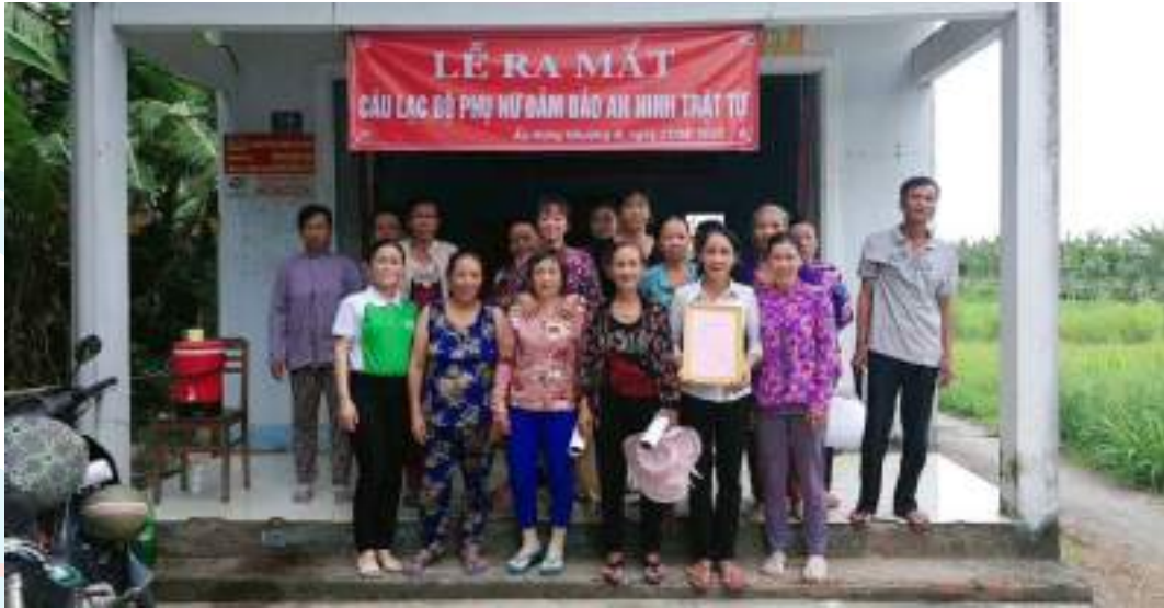
Hội LHPN xã Phương Thạnh, huyện Càng Long, tỉnh Trà Vinh ra mắt Cầu lạc đồ phụ nữ đảm bảo an ninh trật tự tại ấp Hưng Nhượng B

Thành tích nổi bật: Thực hiện phong trào thi đua của Hội gắn với “Học tập và làm theo tư tưởng, đạo đức, phong cách Hồ Chí Minh”: tặng học bổng, tặng Mái ấm tình thương, tổng số tiền 137 triệu đồng; quản lý 19 tổ tiết kiệm vay vốn, tổng số vốn trên 22 tỷ đồng cho 983 thành viên vay; duy trì 20 tổ phụ nữ Tiết kiệm tín dụng có 1.045 thành viên, gửi trên 517.194.000 đồng cho 1.045 lượt hộ vay. Thành lập 01 CLB phụ nữ khởi nghiệp (20 thành viên); giúp 300 lao động nữ có việc làm, trên 200 hộ phụ nữ thoát nghèo; có trên 80% hộ gia đình hội viên đạt hộ 5 không, 3 sạch. Tỷ lệ phát triển hội viên đạt 79,5% so số hộ có phụ nữ 18 tuổi trở lên.