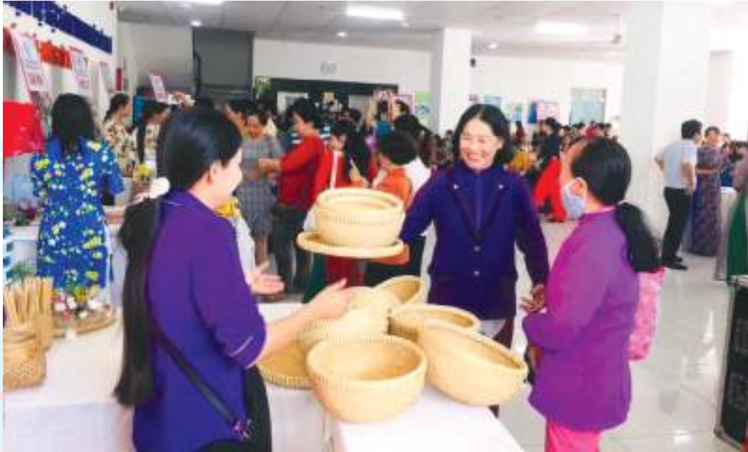
Gian hàng trưng bày hàng đan lát truyền thống của chị em phụ nữ quận Cái Răng tham gia Ngày hội Phụ nữ sáng tạo khởi nghiệp năm 2020

Thành tích nổi bật: Thực hiện nhiều giải pháp hỗ trợ phụ nữ giảm nghèo, phát triển kinh tế, hỗ trợ 53.347 lượt chị vay vốn sản xuất, khởi sự kinh doanh, khởi nghiệp với số tiền 1.162,163 tỷ đồng; tổ chức 243 lớp nghề cho 7.690 chị em, tư vấn giới thiệu việc làm cho 154.841 chị; giúp 11.250 lượt hộ nghèo do phụ nữ làm chủ hộ, đã thoát nghèo 4.977 hộ; vận động xây dựng, sửa chữa 269 Mái ấm tình thương trị giá trên 8,5 tỷ đồng; 4.810 suất học bổng và 25.778 phần quà tổng trị giá trên 9,5 tỷ đồng. Thăm hỏi, hỗ trợ phụ nữ nghèo, khó khăn 63.417 trường hợp tổng trị giá trên 17,6 tỷ đồng. Tỷ lệ thu hút tập hợp hội viên đạt 62,63%.