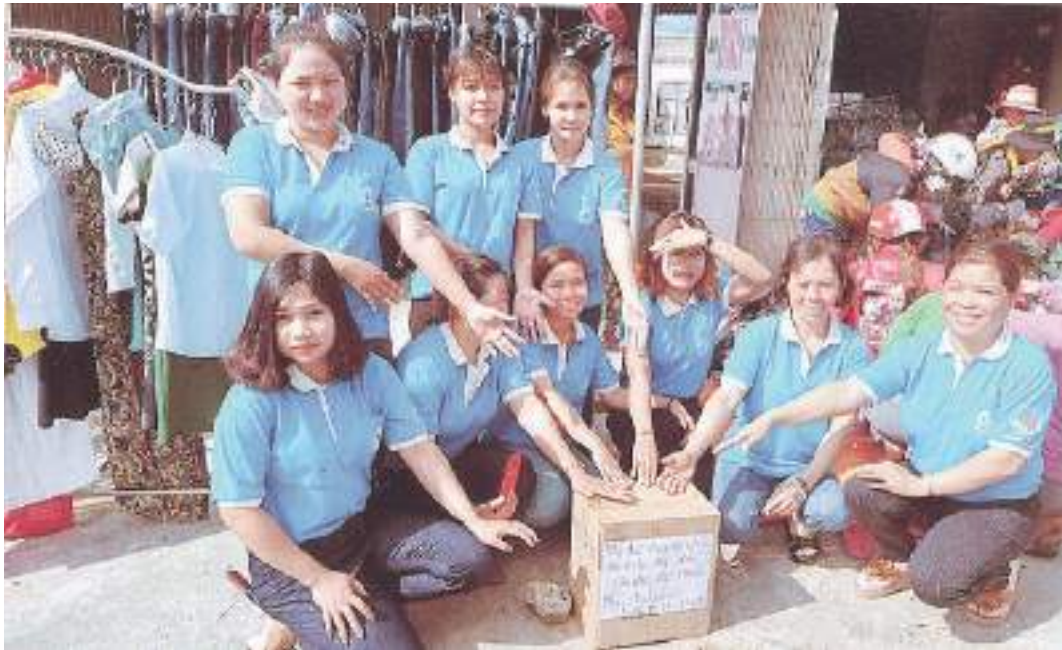
Hội Liên hiệp Phụ nữ xã Sơn Hội, huyện Sơn Hòa quyên góp quần áo giúp phụ nữ nghèo

Thành tích nổi bật: Có nhiều sáng tạo, đổi mới trong công tác tuyên truyền, giáo dục, vận động, thu hút phụ nữ dân tộc thiểu số. Toàn xã có 13 CLB với 409 thành viên tham gia; trong đó CLB “Gia đình 5 không, 3 sạch”, “Phụ nữ dân tộc thiểu số tiếp bước cho em đến trường”, “Đồng hành cùng phụ nữ dân tộc thiểu số” thu hút nhiều chị em phụ nữ dân tộc. Hoạt động “Ai thừa đến cho, ai thiếu đến lấy” của CLB “Đồng hành cùng phụ nữ dân tộc thiểu số” đã giúp cho bà con khó khăn có những bộ quần áo lành. 100% hội viên phụ nữ dân tộc thiểu số tham gia thực hiện cuộc vận động học tập và làm theo Bác bằng các hoạt động thiết thực: “Treo ảnh Bác nơi trang trọng trong nhà”, thực hiện “Hũ gạo yêu thương”, “Heo đất tiết kiệm”. Hội đã giúp vốn vay ưu đãi cho 42 chị, trong đó 19 gia đình phụ nữ vươn lên thành hộ khá; duy trì hoạt động tiết kiệm được hơn 274 triệu đồng, vận động 1.958kg gạo, 17 chỉ vàng, 147 triệu đồng giúp cho 75 chị em khó khăn, phụ nữ dân