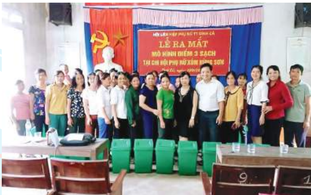
Hội LHPN thị trấn Đình Cả, huyện Võ Nhai, tỉnh Thái Nguyên ra mắt mô hình điểm 3 sạch

Thành tích nổi bật: Đã thành lập 17 mô hình, CLB thu hút đông đảo hội viên mọi lứa tuổi (tỷ lệ thu hút hội viên đạt 87,8%). Thực hiện tốt các hoạt động hỗ trợ hội viên phụ nữ phát triển kinh tế, phối hợp với các sở, ngành tổ chức dạy nghề, tư vấn việc làm cho 157 người và tạo việc làm ổn định cho 142 chị; có 419 lượt hội viên tham gia gửi tiết kiệm được 1.486 triệu đồng, 180 lượt hội viên phụ nữ nghèo vay đầu tư phát triển kinh tế gia đình. Tham gia các hoạt động nhân đạo, từ thiện khác với tổng giá trị tiền, quà tặng và ủng hộ được 6,555 triệu đồng; các loại quỹ được 33,429 triệu đồng; xây dựng được 2 Mái ấm tình thương cho phụ nữ nghèo trị giá 28 triệu đồng; tặng học bổng cho 53 học sinh nghèo có hoàn cảnh khó khăn trị giá 10,3 triệu đồng; ủng hộ hội viên mắc bệnh hiểm nghèo trị giá 6,95 triệu đồng; thành lập 01 mô hình "Nồi cháo nghĩa tình, bữa cháo miễn phí" hỗ trợ cho các bệnh nhân có hoàn cảnh khó khăn của Trung tâm y tế huyện.