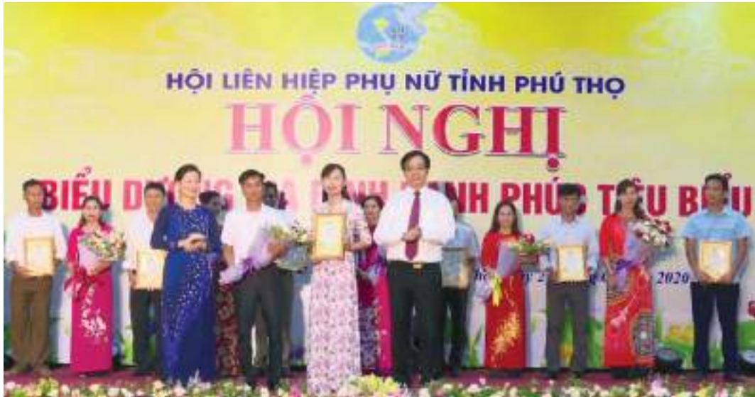
Hội nghị biểu dương gia đình hạnh phúc tiêu biểu năm 2020

Thành tích nổi bật: Thực hiện có hiệu quả các Đề án của Chính phủ, trong đó thực hiện Đề án “ Hỗ trợ phụ nữ khởi nghiệp ”, Hội hỗ trợ hơn 59.000 hộ gia đình và hội viên phụ nữ vay vốn khởi nghiệp, khởi sự kinh doanh với tổng dư nợ 1.289 tỷ đồng; làm tốt công tác hậu phương quân đội, bảo vệ chủ quyền an ninh biên giới: thăm hỏi, tặng hơn 18.000 suất quà cho Mẹ Việt Nam anh hùng, gia đình chính sách, người có công với cách mạng, gia đình có người bị nhiễm chất độc màu da cam, trẻ em bị khuyết tật, gia đình có chồng con đang làm nhiệm vụ bảo vệ biên giới, hải đảo tổng trị giá 2,6 tỷ đồng; tổ chức 1.025 hoạt động tuyên truyền phòng chống âm mưu và hoạt động diễn biến hòa bình cho hơn 535 nghìn lượt cán bộ, hội viên, phụ nữ. Đẩy mạnh thực hiện Chương trình “ Đồng hành cùng phụ nữ biên cương ” với nguồn lực vận động gần 5 tỷ đồng hỗ trợ phụ nữ, học sinh nghèo xã biên giới tỉnh Lai Châu. Nhiều mô hình tập hợp, thu hút hội viên với tỷ lệ thu hút đạt 84,2%.