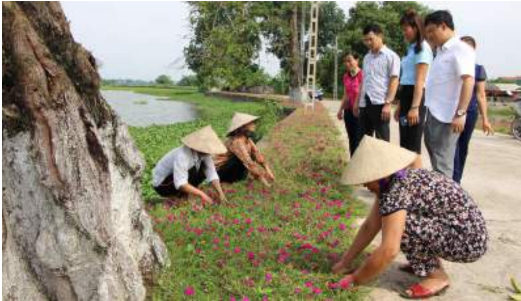
Lãnh đạo UBND huyện Vĩnh Tường thăm đoạn đường hoa phụ nữ xã Ngũ Kiên, huyện Vĩnh Tường, tỉnh Vĩnh Phúc