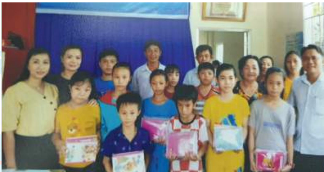
Chi hội Phụ nữ nhóm 5, phường 1, thành phố Cà Mau tổ chức lễ ra mắt “Tổ phụ nữ hướng dẫn trẻ em sử dụng internet an toàn”

Thành tích nổi bật: Thực hiện mô hình “Xóa hộ trắng Hội viên”, đến nay Hội LHPN phường đã thu hút hội viên vào tổ chức Hội đạt 69,5% với tổng số hội viên 2.726/3.920. Tổ chức nhiều hoạt động, nhiều mô hình về công tác bảo vệ môi trường như: Hội thi “Vệ sinh an toàn thực phẩm”; vận động chị em, hội viên phụ nữ thực hiện có hiệu quả phong trào chống rác thải nhựa; phân loại rác thải, sử dụng các vật liệu thân thiện với môi trường như lá chuối, túi sinh học để đựng thực phẩm. Triển khai mô hình “Tấm lòng vì phụ nữ nghèo” được trên 28.500.000 đồng, giải quyết cho 18 chị hội viên có hoàn cảnh đặc biệt khó khăn mượn, thời gian 12 tháng. Mô hình “Tổ phụ nữ thiện tâm” đã vận động mạnh thường quân hỗ trợ 300kg gạo/tháng để nấu cho bệnh nhân có hoàn cảnh khó khăn tại Bệnh viện Y học cổ truyền, tặng quần áo cũ đến chị em hội viên trên địa bàn và người nuôi bệnh.