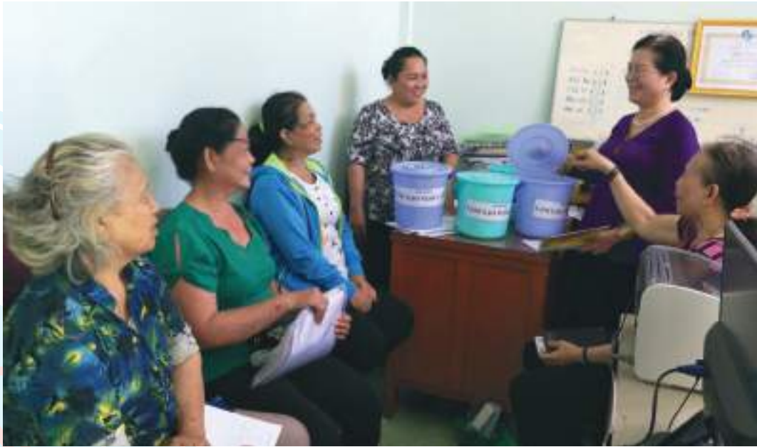
Hội LHPN phường 10, TP. Mỹ Tho, tỉnh Tiền Giang tổ chức sinh hoạt mô hình "Hũ gạo tình thương" thực hiện Chỉ thị 05-CT/TW

Thành tích nổi bật: Hàng năm, triển khai cho cán bộ, hội viên, phụ nữ đăng ký 01 hành động việc làm cụ thể để học tập và làm theo Bác theo tinh thần Chỉ thị số 05-CT/TW của Bộ Chính trị. Đã có 1.687 chị đăng ký thực hiện tiết kiệm 1,176 triệu đồng, giúp cho phụ nữ nghèo. Vận động phụ nữ giúp nhau phát triển kinh tế thông qua các hình thức cho mượn không lãi, bán chịu trả dần con giống... với tổng trị giá 595 triệu đồng. Thực hiện nhiều công trình/phần việc xây dựng nông thôn mới, đô thị văn minh với tổng số tiền 430 triệu đồng. Hỗ trợ hội viên phụ nữ khởi sự kinh doanh từ các nguồn vốn Ngân hàng CSXH và Quỹ hỗ trợ phụ nữ phát triển kinh tế tỉnh Tiền Giang với số tiền 350 triệu đồng. Khai thác vốn trên 9 tỷ đồng giúp 519 hội viên vay phát triển kinh tế, giới thiệu việc làm cho 375 chị, góp phần thoát nghèo, ổn định cuộc sống.