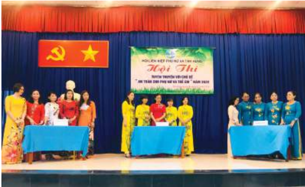
Hội LHPN xã Tân Hưng, thành phố Bà Rịa, tỉnh Bà Rịa - Vũng Tàu tổ chức Hội thi tuyên truyền với chủ đề “An toàn cho phụ nữ và trẻ em”

Thành tích nổi bật: Tổ chức thực hiện hiệu quả Phong trào thi đua, các cuộc vận động của Hội, phong trào “Dân vận khéo” với nhiều mô hình, điển hình, đã có 64 gương tập thể, cá nhân tiêu biểu được khen thưởng, biểu dương. Xây dựng và duy trì hiệu quả các mô hình hoạt động xã hội, nhân đạo như mô hình “ Tổ thiện tâm ”, “ Thu gom phế liệu giúp hội viên nghèo mua thẻ bảo hiểm y tế ”, “ Chuyển giao, hỗ trợ vật dụng cho phụ nữ nghèo ”... có nhiều hình thức hỗ trợ, giúp đỡ phụ nữ thoát nghèo, năm 2018 thành lập Hợp tác xã Nông nghiệp - Dịch vụ Tân Hưng do phụ nữ làm quản lý hoạt động hiệu quả.