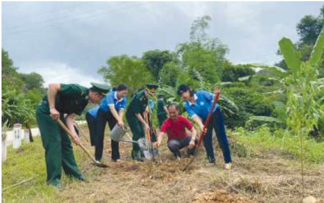
Hội LHPN tỉnh phối hợp với Bộ Chỉ huy Bộ đội Biên phòng ra quân triển khai trồng “Đường hoa đào biên giới” tại đồn Biên phòng Na Hình, huyện Văn Lãng ngày 23/9/2020.

Thành tích nổi bật: Sáng tạo triển khai các phong trào thi đua và các cuộc vận động gắn với nhiệm vụ chính trị: có trên 500 công trình, phần việc đăng ký, hỗ trợ xây mới 11.525 công trình nhà tiêu hợp vệ sinh, vận động đóng góp trên 41 tỷ đồng, 286.731 ngày công, 25.053 hộ đạt các tiêu chí; duy trì, triển khai xây mới 95 nhà, sửa chữa 27 nhà trị giá trên 1,6 tỷ đồng quỹ “Mái ấm tình thương” cho phụ nữ nghèo; duy trì được 1.932 chi/tổ phụ nữ thực hiện ít nhất mô hình tiết kiệm theo gương Bác, trên 600 mô hình “Dân vận khéo”, xây dựng thêm 114 mô hình nuôi lợn nhựa, nhóm phụ nữ tiết kiệm... được trên 16 tỷ đồng, 1.768kg gạo.