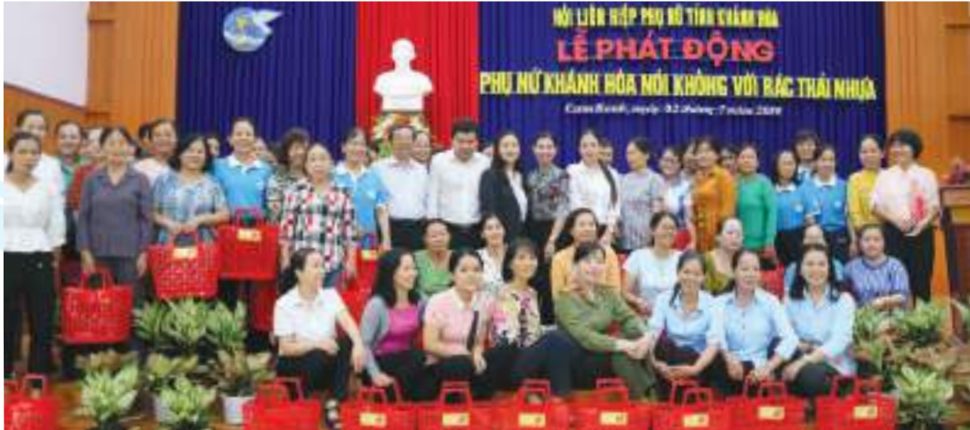
Lễ phát động “Phụ nữ Khánh Hòa nói không với rác thải nhựa”

Thành tích nổi bật: Có nhiều sáng kiến, giải pháp đổi mới trong chỉ đạo thực hiện công tác Hội đạt kết quả nổi bật: trao tặng 867 phương tiện sinh kế, 51.292 suất quà, 1.858 suất học bổng, 365 sổ tiết kiệm, xây dựng và sửa chữa 391 Mái ấm tình thương thực hiện 728 công trình, phần việc xây dựng nông thôn mới, đô thị văn minh, vận động người dân hiến 90.720m 2 đất làm đường, hàng ngàn ngày công tham gia xây dựng nông thôn mới với tổng kinh phí gần 100 tỷ đồng. Phát hiện, biểu dương, tuyên truyền, nhân rộng 759 gương điển hình phụ nữ, mô hình tiêu biểu, cách làm hay, sáng tạo trên các lĩnh vực. Phối hợp tổ chức 1.027 lớp tập huấn, 43.743 buổi truyền thông, nói chuyện chuyên đề về các chính sách luật pháp liên quan đến phụ nữ, trẻ em, về tình hình biển, đảo của Tổ quốc... duy trì và thành lập mới nhiều mô hình tập hợp, thu hút hội viên: mô hình Chi hội Phụ nữ mẫu, Chi hội Phụ nữ mẫu xuất sắc tiêu biểu, Chi hội Phụ nữ giúp Chi hội Phụ nữ. Tỷ lệ thu hút tập hợp hội viên đạt 73%.