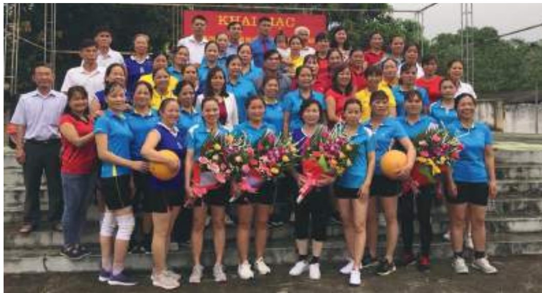
Hội Liên hiệp Phụ nữ thị trấn Thác Bà, huyện Yên Bình, tỉnh Yên Bái khai mạc Giải bóng chuyền nữ

Thành tích nổi bật: Tổ chức triển khai, thực hiện tốt các phong trào yêu nước và nhiệm vụ trọng tâm công tác Hội. Phong trào “Phụ nữ làm kinh tế giỏi” đã được đẩy mạnh với 50 hộ gia đình hội viên phụ nữ có thu nhập cao; hỗ trợ 12 hội viên phụ nữ khởi nghiệp; giúp 15 hộ gia đình hội viên phụ nữ thoát nghèo; tham gia Cuộc vận động “Xây dựng gia đình 5 không, 3 sạch”: thường xuyên vệ sinh đường làng, ngõ xóm; xây dựng các đoạn đường phụ nữ tự quản; tổ chức trồng và chăm sóc 200m đường hoa, cây xanh; vận động gia đình hội viên phụ nữ hạn chế sử dụng túi nilon, đào hố rác, phân loại và xử lý rác thải tại gia đình và đồng ruộng theo đúng quy định. Đặc biệt, phối hợp vận động gia đình hội viên phụ nữ ủng hộ làm 3,6km đường giao thông với tổng số tiền là 2,52 tỉ đồng. Kết nạp thêm 80 hội viên đưa tổng số hội viên toàn thị trấn lên 656 hội viên, đạt tỷ lệ thu hút 84%; giới thiệu và kết nạp thêm được 10 Đảng viên nữ.