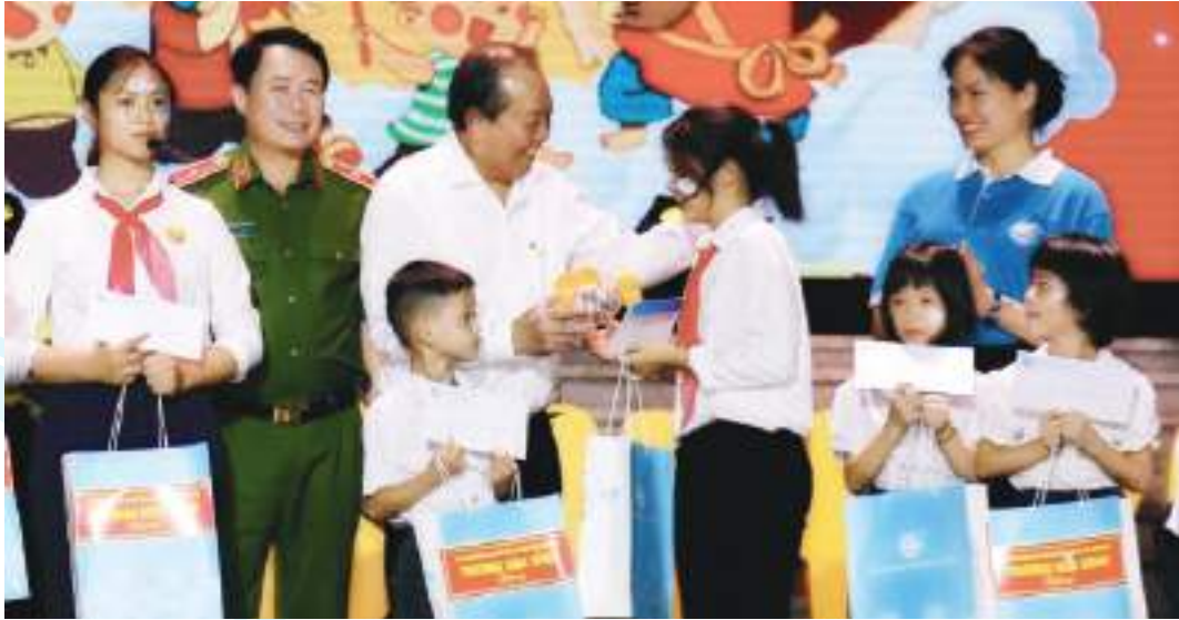
Phó Thủ tướng Thường trực Trương Hòa Bình và Chủ tịch Hội LHPN Việt Nam Hà Thị Nga tặng quà cho các em có hoàn cảnh đặc biệt khó khăn tại Chương trình “ Trăng bình yên ” nhân dịp Tết Trung thu 2020