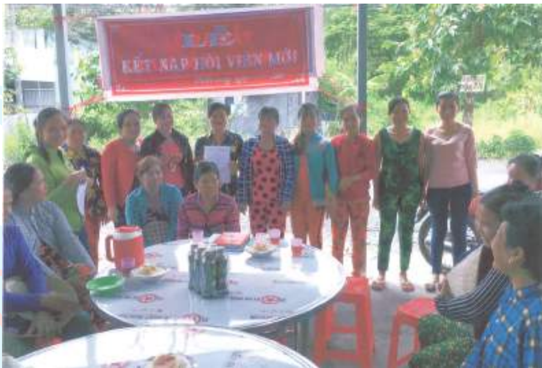
Hội LHPN thị trấn Phước Long, huyện Phước Long, tỉnh Bạc Liêu tổ chức kết nạp hội viên mới

Thành tích nổi bật: Có nhiều hình thức tập hợp hội viên thông qua các hoạt động của 47 câu lạc bộ, tổ, nhóm; xây dựng 1.093 hội viên nông cốt. Tham gia giúp đỡ 360/360 hộ nghèo do phụ nữ làm chủ hộ; giúp đỡ, hỗ trợ vốn cho 37 hộ nghèo với tổng số tiền 74 triệu đồng; phát động heo đất khuyến học được 2.787 con, tổng số tiền là 1.612.416.000 đồng. Thành lập 17 tổ góp vốn xoay vòng, có 296 thành viên, tổng số tiền là 72.700.000 đồng cho hơn 500 lượt chị vay; tư vấn và giới thiệu cho gần 150 lao động nữ làm việc tại các công ty, các trường, điểm tập hóa góp phần làm giảm tỷ lệ hộ nghèo chung trong toàn thị trấn.