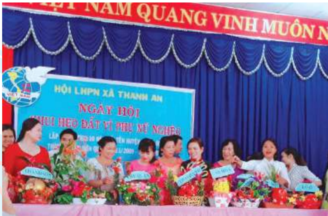
Ngày hội khai heo đất giúp đỡ hội viên nghèo Hội LHPN xã Thanh An, huyện Hồn Quản, tỉnh Bình Phước

Thành tích nổi bật: Phát động và duy trì phong trào “Nuôi heo đất tình thương”, được 100% các chi hội hưởng ứng, thu hút trên 100% hội viên tham gia. Đến nay tại các chi hội đã nuôi 48 con heo đất với tổng số tiền 134.315.000 đồng hỗ trợ, trong đó xây được 02 căn Mái ấm tình thương, số tiền 50.000.000 đồng, 18 sổ tiết kiệm, 5 thẻ BHYT, 09 con dê, 300 con gà giống, 600 con ngan giống, 150 cây cao su giống,... tổng số tiền trên 80.000.000 đồng giúp 75 chị hội viên nghèo. Mô hình “Một giúp nhiều người” do Hội xây dựng hiện nay giúp trên 40 lượt chị vay với số vốn lên hàng chục triệu đồng; Mô hình “Mười trong Một” giúp được 05 công trình vệ sinh, 08 bình lọc nước, tổng số tiền 98.000.000 đồng.