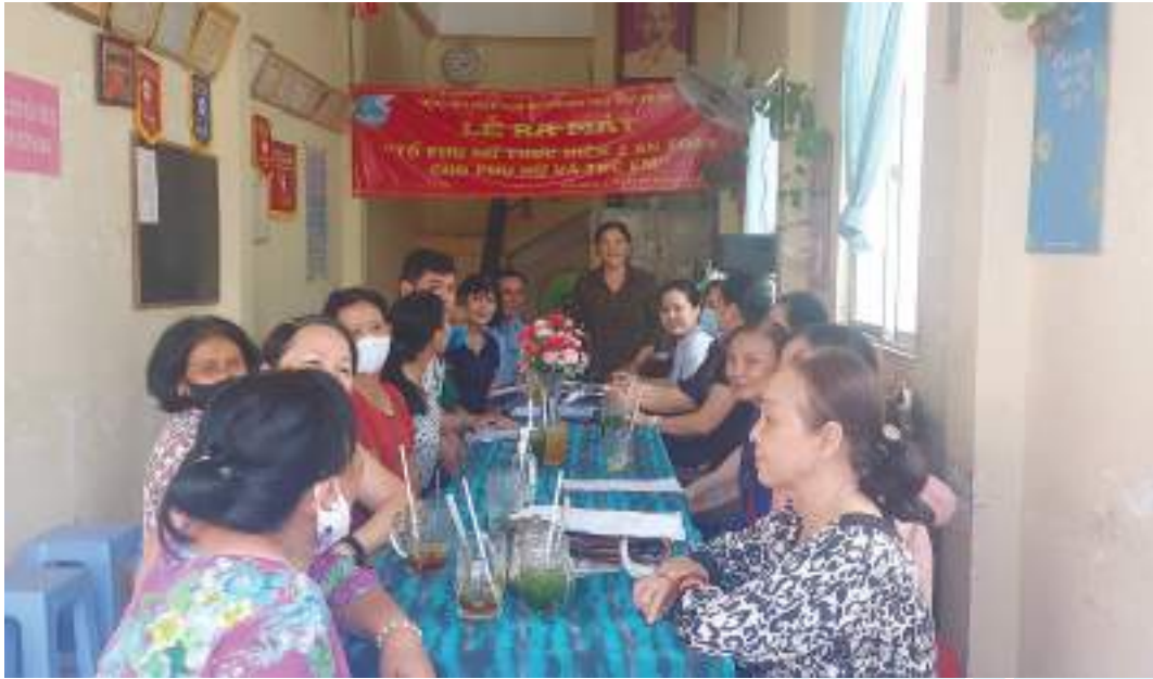
Lễ ra mắt “Tổ phụ nữ thực hiện 2 an toàn cho phụ nữ và trẻ em” của Hội LHPN phường 2, thành phố Sóc Trăng

Thành tích nổi bật: 2.548 cán bộ, hội viên đăng ký thực hiện các phong trào thi đua, 2.049 chị được công nhận đạt 3 tiêu chuẩn phong trào thi đua nhiều năm liền. Xây dựng 04 mô hình tiết kiệm làm theo Bác, tiết kiệm được 2.173Kw điện, 1.969m 3 nước, đóng góp trên 500 bộ quần áo, cặp sách; hỗ trợ không hoàn lại cho 8 chị với số tiền trên 10 triệu đồng; các tổ tiết kiệm - tương trợ huy động được 7.651 triệu đồng, cho 1.435 lượt hội viên vay; vận động xây dựng 03 Mái ấm tình thương trị giá 124 triệu đồng; giúp 80 hộ nghèo do nữ làm chủ hộ thoát nghèo; giáo dục, cảm hóa, giúp đỡ 06 phụ nữ hoàn lương, có việc làm ổn định, hỗ trợ 45 hộ đạt 8 tiêu chí “5 không, 3 sạch”, nâng tổng số 1.771 hộ đạt 8 tiêu chí. Các mô hình nổi bật: Tổ thực hiện 5 không, 3 sạch, Tổ phụ nữ dùng giỏ đi chợ, CLB biển rác thành tiền... có 426 chị tham gia; xây dựng 01 tuyến đường văn minh, vận động 139 nữ tiểu thương thực hiện “chợ an toàn thực phẩm”; tổ chức hội thi “tái chế sản phẩm bằng nhựa”;