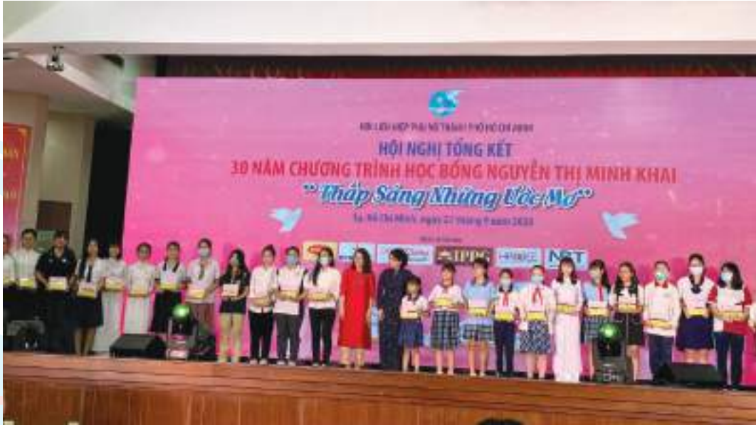
Hội LHPN thành phố Hồ Chí Minh tổ chức hội nghị tổng kết 30 năm Chương trình học bổng Nguyễn Thị Minh Khai “Thắp sáng những ước mơ”

Thành tích nổi bật: Có nhiều giải pháp trong đổi mới nội dung, phương thức hoạt động Hội: ứng dụng công nghệ thông tin trong quản lý và đào tạo cán bộ, hội viên, phụ nữ, nâng chất lượng các kênh thông tin và truyền thông; giám sát, can thiệp, hỗ trợ bảo vệ quyền và lợi ích hợp pháp, chính đáng của phụ nữ và trẻ em, với 2.123 mô hình an toàn cho phụ nữ trẻ em ở khu phố/ấp và 2.026 Tổ tư vấn cộng đồng. Có nhiều mô hình, cách làm hay thực hiện phong trào “Chống rác thải nhựa”, huy động nguồn lực chăm lo tốt cho hội viên, phụ nữ, đã hỗ trợ 2.106 phương tiện sinh kế và trao 33.457 suất học bổng Nguyễn Thị Minh Khai với tổng số tiền hơn 52 tỷ đồng, giúp đỡ 10.079 hộ nghèo do phụ nữ làm chủ thoát nghèo theo chuẩn (2016 - 2018) của thành phố. Tỷ lệ thu hút tập hợp hội viên đạt 83,7%.