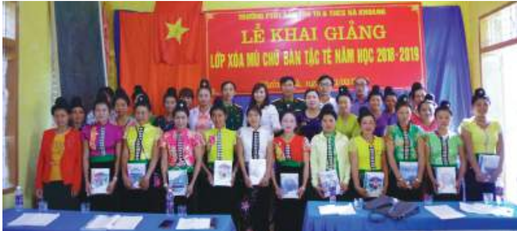
Khai giảng lớp xóa mù chữ tại xã Mường Và, huyện Sốp Cộp, tỉnh Sơn La

Thành tích nổi bật: Thực hiện có hiệu quả Cuộc vận động “Xây dựng gia đình 5 không, 3 sạch”, tham gia xây dựng nông thôn mới, có 612 phần việc đăng ký với cấp ủy góp phần xây dựng nông thôn mới, đô thị văn minh; vận động đào trên 30.000 hố rác, 818 lò đốt rác, duy trì và trồng mới 150 con đường hoa, hiến 18.996m 2 đất và 613 cây lâu năm, góp trên 37.446 ngày công lao động làm đường giao thông nông thôn. Xây dựng 15 mô hình “Chi hội phụ nữ 5 không, 3 sạch xây dựng nông thôn mới”, 265 mô hình “Tuyến đường phụ nữ tự quản”. Triển khai các chương trình, dự án cho hội viên phụ nữ vay để phát triển kinh tế; phối hợp thành lập 11 HTX do phụ nữ làm chủ; hỗ trợ 2.333 phụ nữ khởi sự kinh doanh và khởi nghiệp. Hỗ trợ xây dựng 88 Mái ấm tình thương, tổng số tiền là 2,467 tỷ đồng; duy trì 17 loại mô hình “làm theo Bác”, 608 mô hình “Dân vận khéo” (344 tập thể, 264 cá nhân); 100% cán bộ Hội LHPN cấp tỉnh, cán bộ chủ chốt cấp huyện, 196/204 Chủ tịch Hội LHPN cấp cơ sở đạt tiêu chuẩn chức danh theo quy định. Làm tốt công tác vận động hội viên, phụ nữ tham gia các lớp học xóa mù chữ và giáo dục sau biết chữ. Tỷ lệ thu hút tập hợp hội viên đạt 74%.