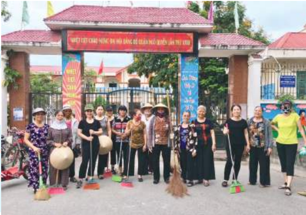
Hội viên, phụ nữ quận Ngô Quyền, thành phố Hải Phòng ra quân tổng vệ sinh ngõ, phố

Thành tích nổi bật: Đẩy mạnh công tác tuyên truyền thông qua hoạt động của “Đội xung kích thay đổi hành vi”, tổ chức được 305 buổi tuyên truyền cho trên 20.000 cán bộ, hội viên tham gia; hỗ trợ 29.289 gia đình đạt 8 tiêu chí cuộc vận động “Xây dựng gia đình 5 không, 3 sạch”; kết nối với các ngân hàng, các quỹ hỗ trợ gần 70 tỷ đồng cho 2.750 hộ vay để phát triển kinh tế gia đình; giúp đỡ 246 hộ thoát nghèo; duy trì 294 Tổ phụ nữ tín dụng tiết kiệm với 16.633 thành viên, số vốn gần 3 tỷ đồng cho 705 thành viên, vận động xây, sửa 25 nhà Mái ấm tình thương tổng trị giá 598 triệu đồng cho hội viên, phụ nữ có hoàn cảnh đặc biệt khó khăn; giới thiệu việc làm và tạo việc làm mới cho 570 lao động nữ, định hướng nghề nghiệp cho 280 thanh thiếu niên.