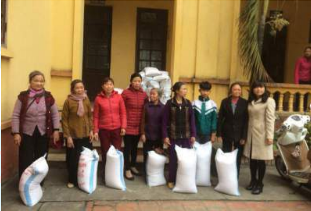
Tặng gạo cho hội viên và trẻ em có hoàn cảnh khó khăn dịp Tết Nguyên đán năm 2020

Thành tích nổi bật: Giúp đỡ 545 hộ đạt các tiêu chí "Gia đình 5 không, 3 sạch"; tuyên truyền vận động hội viên và nhân dân thực hiện phòng chống dịch bệnh Covid-19, cử 44 cán bộ tham gia trực các chốt kiểm dịch, phát tặng hội viên 4.580 khẩu trang các loại, vận động hội viên nhận 42 tin nhắn ủng hộ, quyên góp 1.010 kg gạo và tiền mặt là 30.500.000đ; phát động ủng hộ tiền xây mới và sửa chữa nhà Mái ấm tình thương cho 2 hội viên khó khăn trị giá 21.500.000đ; duy trì 2 chi Hội Xanh - sạch - đẹp, vệ sinh môi trường và an toàn giao thông, gắn biển 2 đoạn đường do phụ nữ tự quản vệ sinh môi trường, xây dựng 7 tổ phụ nữ liên kế với 70 hộ; phát động hội viên hạn chế sử dụng túi nilon và chất thải nhựa một lần, tham gia thu gom rác thải nhựa, gây quỹ ủng hộ phụ nữ nghèo và bảo vệ môi trường, thu gom được trên 7,2 tấn trị giá 13.750.000đ để hỗ trợ hội viên nghèo.