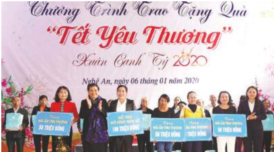
Đồng chí Tổng Thị Phóng, Ủy viên Bộ Chính trị, Phó Chủ tịch Thường trực Quốc hội tặng quà “Tết yêu thương” Xuân Canh Tý 2020 do Hội LHPN Việt Nam tổ chức